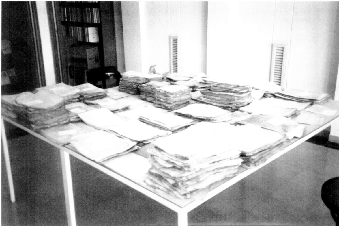
Una petita mostra dels fons documentals durant el procés de classificació i ordenació de la documentació.