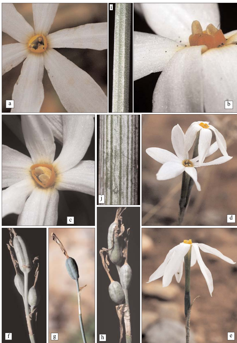
LÁMINA II. Narcissus deficiens Herbert. a, d, e, g) F. J. Fernández Casas Ff-054-08; b, c, f, h) F. J. Fernández Casas Ff-061-08. i, j) F. J. Fernández Casas Ff-058-08. i) Envés foliar. j) Escapo.