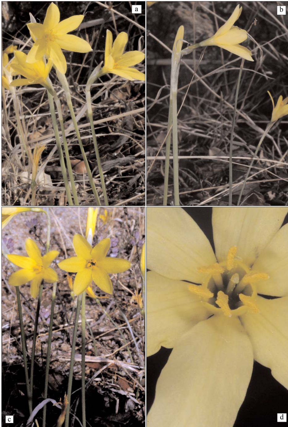
LÁMINA I. a, d) Narcissus × alentejanus Fernández Casas; F. J. Fernández Casas Ff-057-08, typus.