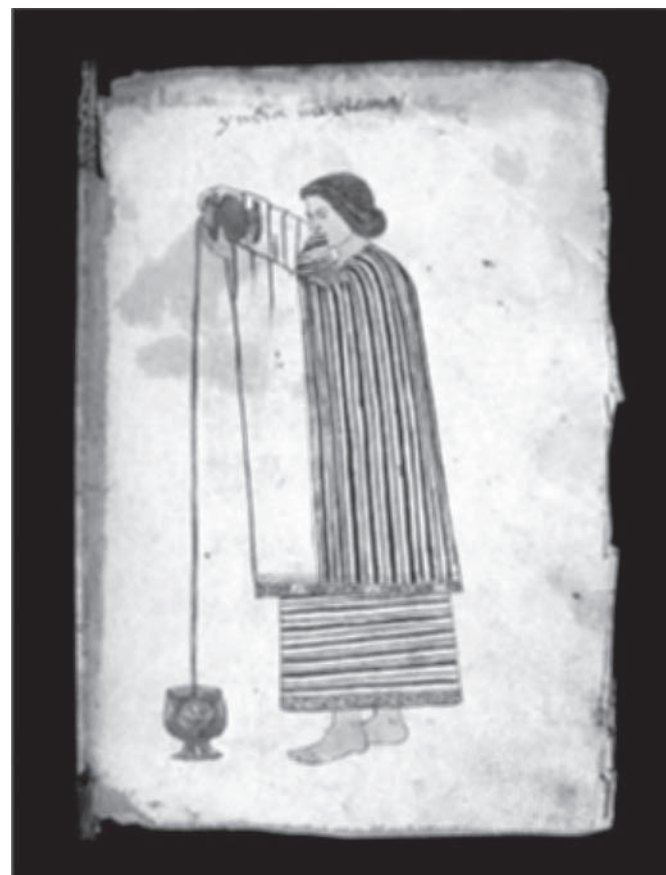
Figura 1. Codice Tudela , fol. 3r. Tomada de un manuscrito pintado en Nueva Espana alrededor de 1553, esta imagen representa una mujer nahua de alto rango social (ver su fina capa), vertiendo chocolate desde cierta altura para producir espuma. Una representacion similar de este mismo proceso aparece en una pieza ceramica del perodo clasico tardo (A.D. 600-900) utilizada por los mayas para servir el chocolate. 21 x 15.5 cm. Tinta sobre papel de fibra vegetal. Reproducida por cortesa del Museo de America, Madrid, Espana.

era una experiencia somatica compleja para los indios precolombinos y coloniales. El nfasis en las especias florales, la espuma, las vasijas especiales para tomarlo, y el tono rojizo de rigor, muestra que el chocolate era valorado no solo por su efecto en las papilas gustativas, sino tambien por la manera en que estimulaba el olfato, el tacto, la vista y el estado emocional.