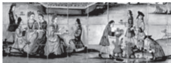
Figura 6. La chocolatada , atribuida al taller de Llorenç Passoles (Barcelona, 1710). Este mural representa una reunión aristocrática. La obra no deja ninguna duda acerca del papel fundamental del chocolate en la socialización de la élite del siglo XVIII, y destaca cómo los aficionados a la bebida seguían apreciando la espuma (en el mural, son los señores y no los sirvientes los que están espumando el chocolate).