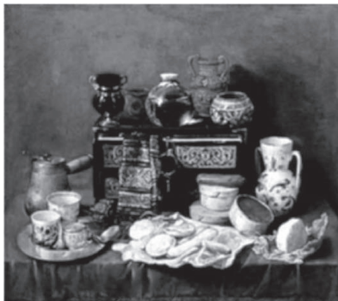
Figura 5. Antonio de Pereda. Naturaleza muerta con cofre de ébano . Esta obra maestra está dedicada a los placeres sensoriales del Nuevo Mundo. A la izquierda

los consumidores españoles internalizaron definiciones mesoamericanas de lujo, y porque el chocolate sin maíz se conservaba mejor en viajes de larga distancia. El atole era preparado generalmente con una pasta viscosa de cacao altamente percedera. De otro lado, la preparación mesoamericana tradicional de chocolate caliente sin maíz utilizaba el cacao en forma de “tableta”. Esta presentación del cacao podía durar “al menos dos años”, lo cual la hacía ideal para las largas travesías a través del Atlántico. 63 Es así que la predominancia de bebidas de cacao sin maíz parece estar relacionada con problemas de almacenamiento en viajes de larga distancia. También es posible que los nahuas vieran las preparaciones con maíz y cacao como bebidas más cotidianas, y la preparación con especias y picante como una bebida para ocasiones especiales. A su vez, si los españoles internalizaron dichas connotaciones, es posible que la élite (la cual era vital para la transmisión trasatlántica del chocolate) haya preferido el chocolate más “lujoso”. 64 En otras palabras, es posible que la desaparición del maíz del chocolate español sea, de hecho, una prueba de la absorción española de valores mesoamericanos.