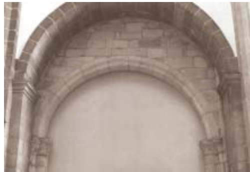
Fig. 13. Iglesia de Santo Domingo de A Coruña. Arquería.