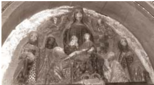
Fig. 8. Tímpano de la Epifanía de San Benito del Campo (Santiago de Compostela).

El tímpano de la Epifanía de Santo Domingo de A Coruña se conserva en el Museo Arqueológico e Histórico de San Antón. Se encuentra muy dañado: la parte inferior se ha perdido y la escena de la derecha está muy raída, con lo cual no se puede identificar. Al