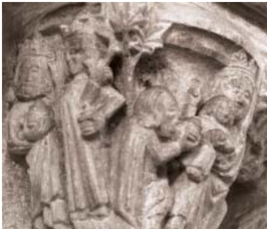
Fig. 6. Clastra Nova de la catedral de Ourense. Capitel de la Epifanía.