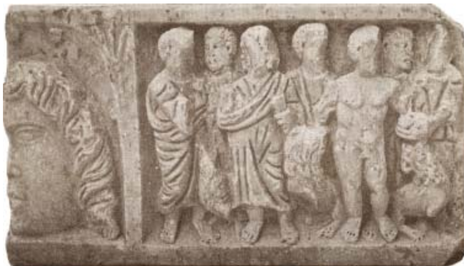
Fig. 24. Sarcófago paleocristiano de Alcaudete (Jaén).