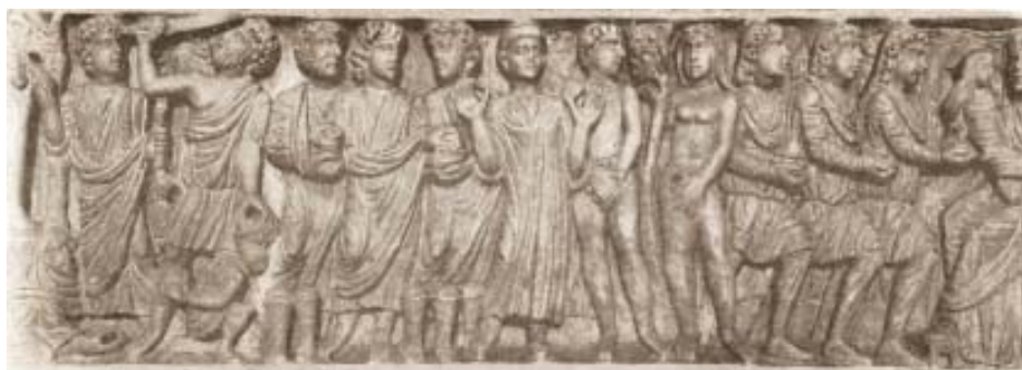
Fig. 25. Sarcófago paleocristiano de Layos. Real Academia de la Historia.

yelmos, están descuartizando con sus espadas a varios inocentes (figs 6, 18-19). En el relieve de la Matanza de los Inocentes del tímpano de la portada del transepto norte de la catedral de Notre-Dame de París (c. 1250) se representan las dos secuencias, muy parecidas al esquema de las Huelgas: Herodes sentado ordena a un subordinado la matanza de los niños; dos mujeres, con sus hijos en brazos, intentan impedir que los dos soldados los ejecuten (fig. 20) 21 .