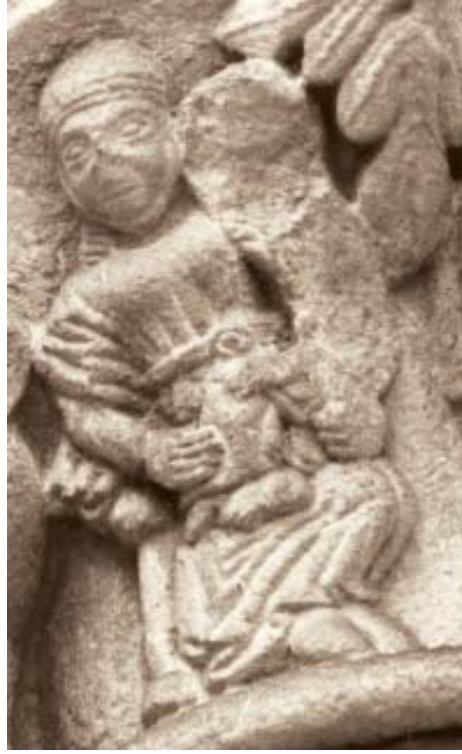
Fig. 16. Iglesia de Santo Domingo de A Coruña. Capitel. Mujer con niño.