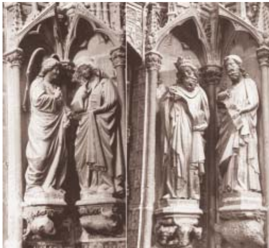
Fig. 3. Portada del claustro de la catedral de Burgos.

Baltasar y Gaspar, en actitud de diálogo, portan sendos botes de ofrendas. Baltasar –imberbe– mira hacia Gaspar –barbado– y con el dedo índice –de tamaño mayor del natural– señala la estrella que les ha guiado ante el Niño (figs. 1, 6). A la derecha se sitúa san José sedente dormido apoyando su cabeza sobre un bastón en tau. Un esquema muy parecido muestra el capitel de la Epifanía de Santa María del Campo (A Coruña), situado en el primer tramo de la nave del Evangelio