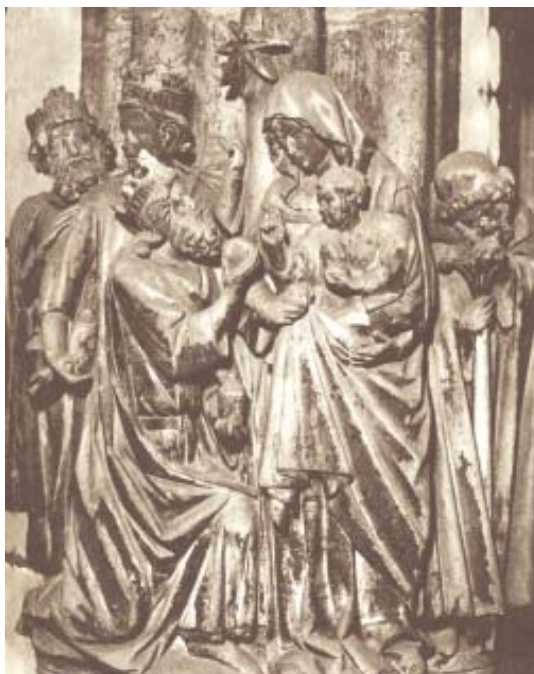
Fig. 10. Tímpano de la Epifanía del claustro de la catedral de Burgos.