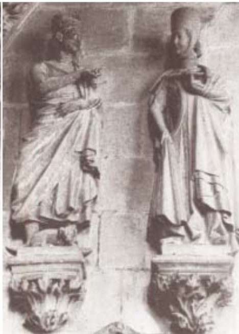
Fig. 23. Esculturas de Fernando III y Beatriz de Suabia. Claustro de la catedral de Burgos.

El capitel del lado opuesto ofrece motivos vegetales muy naturalistas como los que vemos en el alzado de la Claustra Nova orensana. El tipo de desbastado y el fondo liso en algunas zonas, que también se aprecia en los capiteles historiados, responde a los modelos de la Claustra Nova orensana (figs. 6, 17).