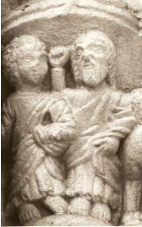
Fig. 15. Iglesia de Santo Domingo de A Coruña. Capitel.