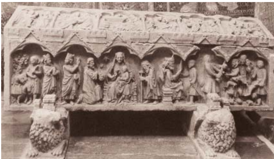
Fig. 11. Sepulchro de doña Berenguela. Monasterio de Santa María la Real de las Huelgas (Burgos).

Niño le falta la cabeza y la de la Virgen se encuentra muy dañada y apenas se aprecian en ella las cuencas de los ojos (fig. 9). Pese al desgaste del conjunto, se percibe que su estilo e iconografía se relacionan con el tímpano de Santa María del Azogue y se podría también fechar hacia el primer cuarto del siglo XIV (fig. 4) 17 .