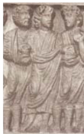
Fig. 26 Sarcófago paleocristiano de Layos. Real Academia de la Historia. Detalle.

El personaje joven de Santo Domingo de A Coruña porta una maza en lugar de la espada (fig. 14). Aquella arma y el gesto de alzarla con el brazo izquierdo la encontramos en una miniatura del beato de San Andrés del Arroyo (c. 1210-1220) (fig. 21) 22 . En algunas representaciones, el personaje romano que recibe la orden de ejecutar la matanza viste de forma más elegante que los soldados 23 .