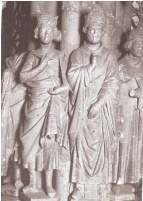
Fig. 22. Esculturas de Fernando III y del obispo Mauricio. Claustro de la catedral de Burgos.