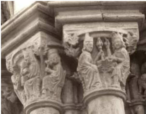
Fig. 1. Clastra Nova de la catedral de Ourense. Capiteles: Epifanía, Salomón y la reina de Saba