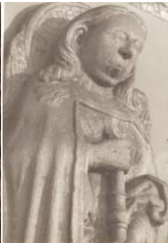
Fig. 2. Clastra Nova de la catedral de Ourense. Ángel trompetero. Detalle.