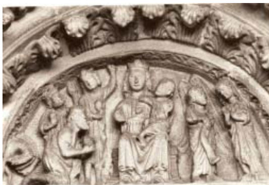
Fig. 5. Tímpano de la Epifanía de Santa María del Azougue (Betanzos).