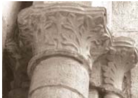
Fig. 17. Iglesia de Santo Domingo de A Coruña. Capiteles vegetales. Detalle.

interpretaciones. Así, los hombres de pie podrían figurar a Yavé o a Adán reconviniendo a Caín por la matanza de su hermano Abel, y la escena contigua, a Eva con su nuevo hijo Set. Otra segunda posibilidad, más remota, sería que el personaje anciano figurase a Abraham riñendo al joven Ismael por burlarse de su hermano Isaac, cuando se celebraba la fiesta de la terminación de la lactancia de éste, lo que motivaría su destierro con su madre Agar. Si la maza del personaje joven no parece muy adecuada para esta secuencia, sí lo sería la figuración de Sara con su hijo Isaac en brazos, cuya edad podría alcanzar los tres años, cuando debió tener lugar aquel acontecimiento. Por otro lado, la postura frontal del animal situado entre las dos secuencias de la escena bíblica coruñesa, y su propio diseño recuerdan a los dibujos de leones de Villar de Honnecourt y de otros libros de modelos. No tendría mayor finalidad que la de rellenar y decorar el resto del capitel, como los demás seres fantásticos y vegetales labrados en los mismos capiteles 19 .