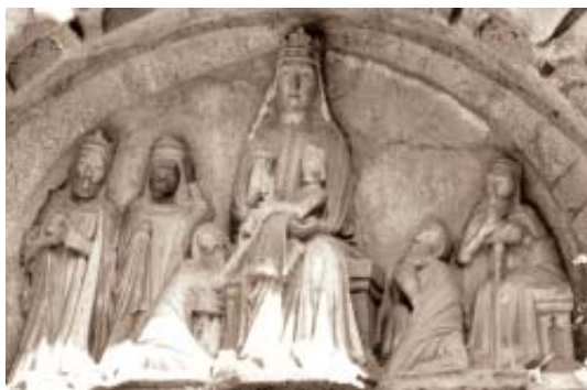
Fig. 4. Tímpano de la Epifanía de San Fiz de Solovio.