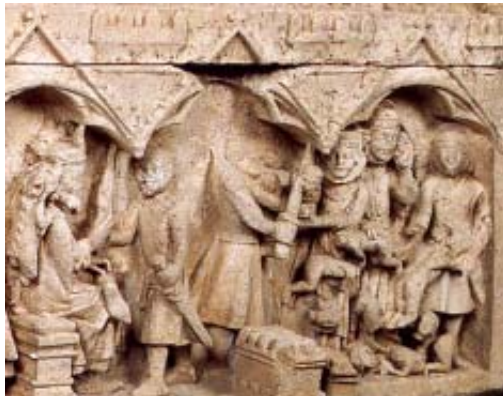
Fig. 19. Sepulcro de doña Berenguela Monasterio de las Huelgas (Burgos). Matanza de los Inocentes.