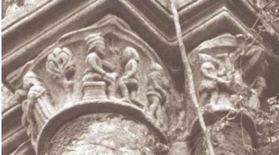
Fig. 18. Iglesia de Santo Domingo de Pontevedra. Capiteles de la Matanza de los Inocentes.