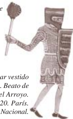
Fig. 21. Militar vestido con perpunte. Beato de San Andrés del Arroyo. c. 1210-1220. París. Biblioteca Nacional.