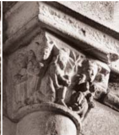
Fig. 7. Santa María del Campo (A Coruña). Capitel de la Epifanía. Detalle.

(fig. 7). El tratamiento de los rostros, aunque algo más rudo, recuerda a los capiteles de la Anunciación y Epifanía de la Clastra Nova orensana. En la parte inferior del soporte de este capitel coruñés figura un epígrafe con la fecha de 1302, lo cual abunda en su filiación orensano-burgalesa en la primera fase del estilo 10 .