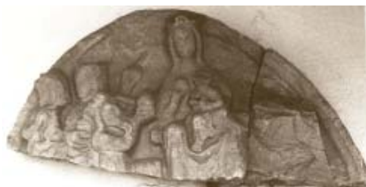
Fig. 9. Tímpano de la Epifanía de Santo Domingo de A Coruña.