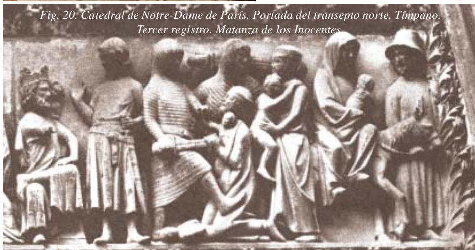
Fig. 20. Catedral de Notre-Dame de París. Portada del transepto norte. Tímpano. Tercer registro. Matanza de los Inocentes.