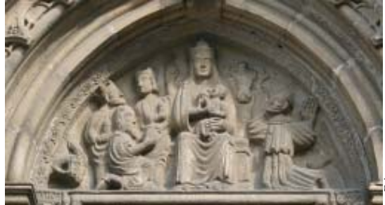
Fig. 12. Tímpano de la Epifanía. San Francisco de Betanzos.

manto con la izquierda; el otro, anciano, con largos cabellos y barbado, levanta la mano derecha en actitud de darle una orden o de recriminarle y sujeta su manto con la otra. A continuación se sitúa un animal –león, dragón o grifo–, con la cabeza mutilada, mirando al frente. En una esquina del capitel central, una mujer sentada de perfil, con el tronco de su cuerpo y la mirada vuelta al espectador, sostiene a un niño en sus rodillas y éste rodea con su brazo el cuello de su madre. El cuerpo del niño, de gran tamaño con respecto al canon de la madre, se halla muy dañado y de él sólo se conservan las manos, el remate de la túnica y los pies (figs. 14-16). El resto del capitel se decora con dragones afrontados y simétricos con colas rameadas, entre motivos vegetales, que nada tienen que ver con el referido asunto historiado. En mi tesis doctoral, Moralejo me sugirió dos posibles