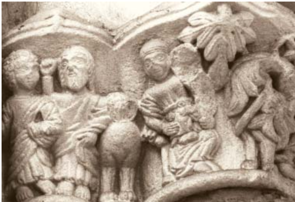
Fig. 14. Iglesia de Santo Domingo de A Coruña. Capiteles.