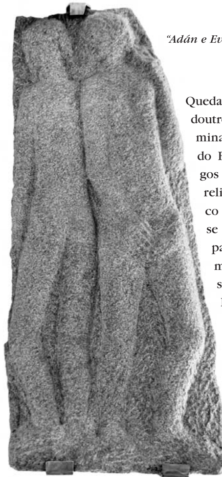
“Adán e Eva”.