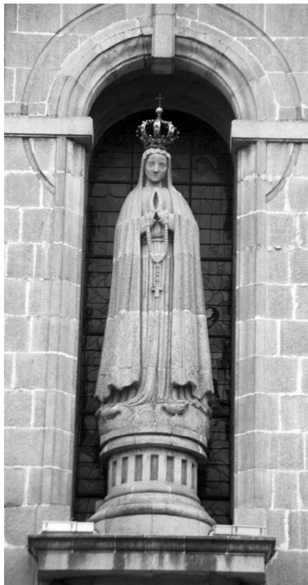
A Virxe de Fátima (1956).