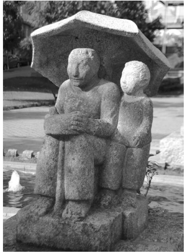
O "afiador" e o "paragueiro" (1957).

Prego, os seus principais mentores. No ano seguinte vai a Vigo, sendo 1951 o do seu empurrón cara América, como temos dito. E de 1953 data a exposición en Madrid, da que ven de volta cargado de magníficas críticas, entre as que se pode salientar a de Camón Aznar, un dos ideólogos do réxime desde o eido cultural, sendo recompensado o ano do monumento nos Salesianos coa presenza na IIª Bienal Hispanoamericana de las Artes, celebrada en Cuba, mostra internacional que repite, agora en Barcelona en setembro de 1955. Así pois, a mediados de 1956 decide renunciar a seguir dando clases na Escola de Artes e Oficios, logo de non ter resposta da súa petición feita uns anos antes. O taller da rúa Bedoya esquina Buenos Aires estabábase xa a facer pequeno e aínda que vai aturar ata 1960, para cambiarse algo máis arriba, na rúa Pardo Bazán, aproximadamente onde está aínda a marmorería funeraria do fillo pequeno do mestre. Non é unha aposta no ar, precisamente. Así acada o grande merecemento no inicio de 1957, de "correspondente" da "Academia de Bellas Artes de San Fernando" (Madrid).