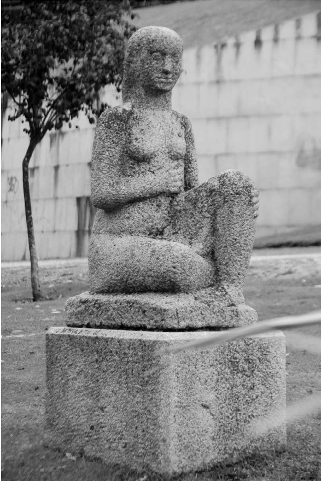
A escultura do Parque Miño é a artisticamente máis persoal das que ten na cidade: a pedra convértese en carne de muller, unba das teimas do noso mestre escultor.