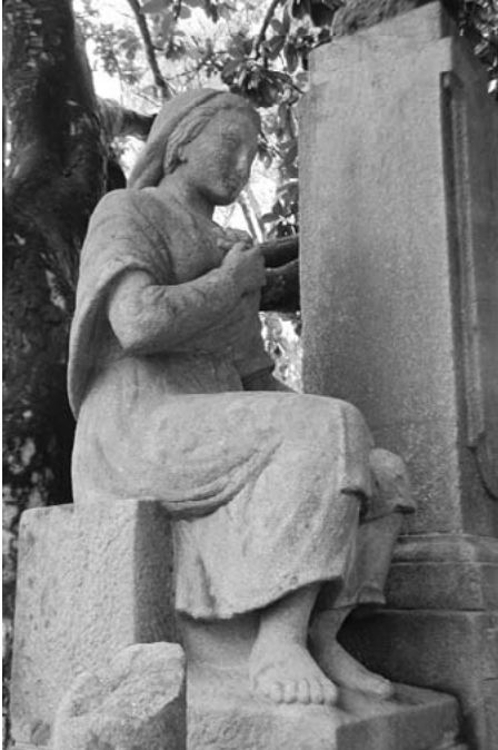
"A rapaza" e "O tío Marcos da Portela", estatuas sedentes a carón do busto de Lamas Carvajal.