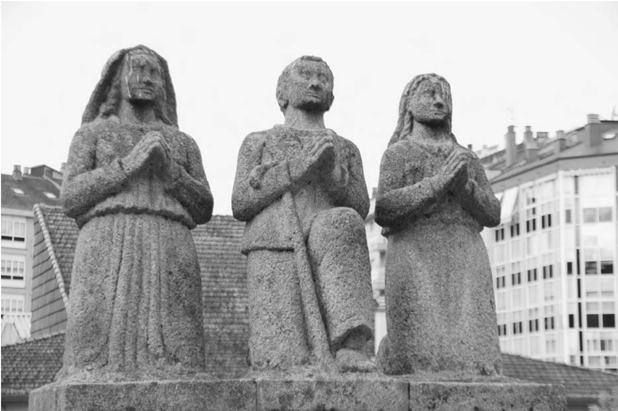
Grupo dos pastoriños da aparición de Fátima (1962).

desde 1954. A obra, que se inicia no arquitectónico na segunda metade do ano 1961, avanza con rapidez, e en setembro de 1963 Faílde xa ten colocados os seis capiteis onde plasma a vida do novo santo, e os grandes relevos do frontis , como Papa, e cómo cura no acto de impartir a comunión.