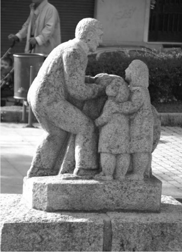
Relevo na fachada do colexio dos Maristas (1959).