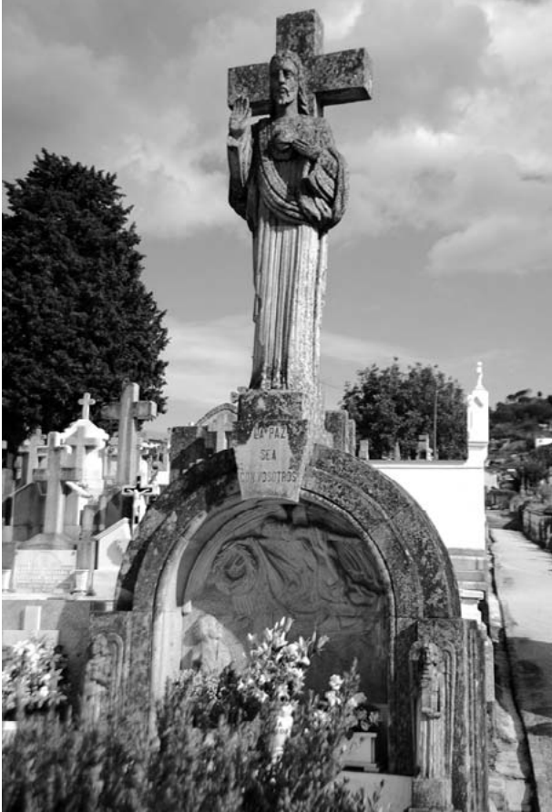
Tumba do Sagrado Corazón, de Darío Barrios.