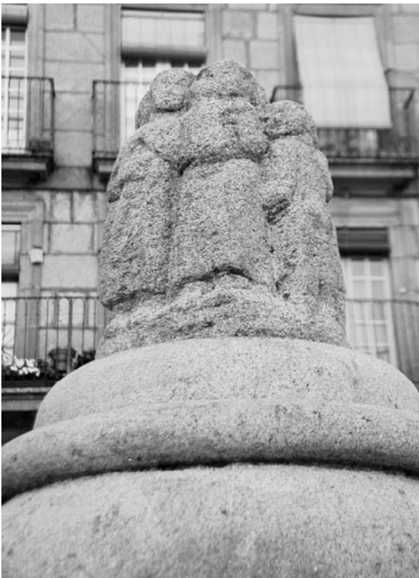
Na fonte da Praza de San Cosme.

Tamén para a nova fonte da Praza de San Cosme , e co fin de estar perdo das obras de Baltar, Virxilio e Quessada na instalación do Belén sito no interior da antiga capela do século XVI se escolleu una pequena peza escultórica de grupo, onde non luce, sexa por a mala escolla, ou polo continente da propia fonte e da árbore central, onde se ubica.