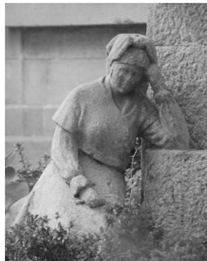
Monumento a Manuel Curros Enríquez (vista xeral) e pormenor de "A Rosiña" (1951).

A súa seguinte obra pública foi na zona N da cidade, para o monumento do poeta Manuel Curros Enríquez, que se lle dedica diante do seu Colexio co gallo do centenario do nacemento en 1951. O busto estaba xa feito por Enrique Barros con anterioridade, decidindo agora que presida un monumento, sobre un alto pedestal, diante do que se colocase a súa obra, "A Rosiña", a rapaciña protagonista da composición do poeta "A Virxe do Cristal", premiada nos Xogos Florais de Ourense en 1877. A mociña de dezaseis