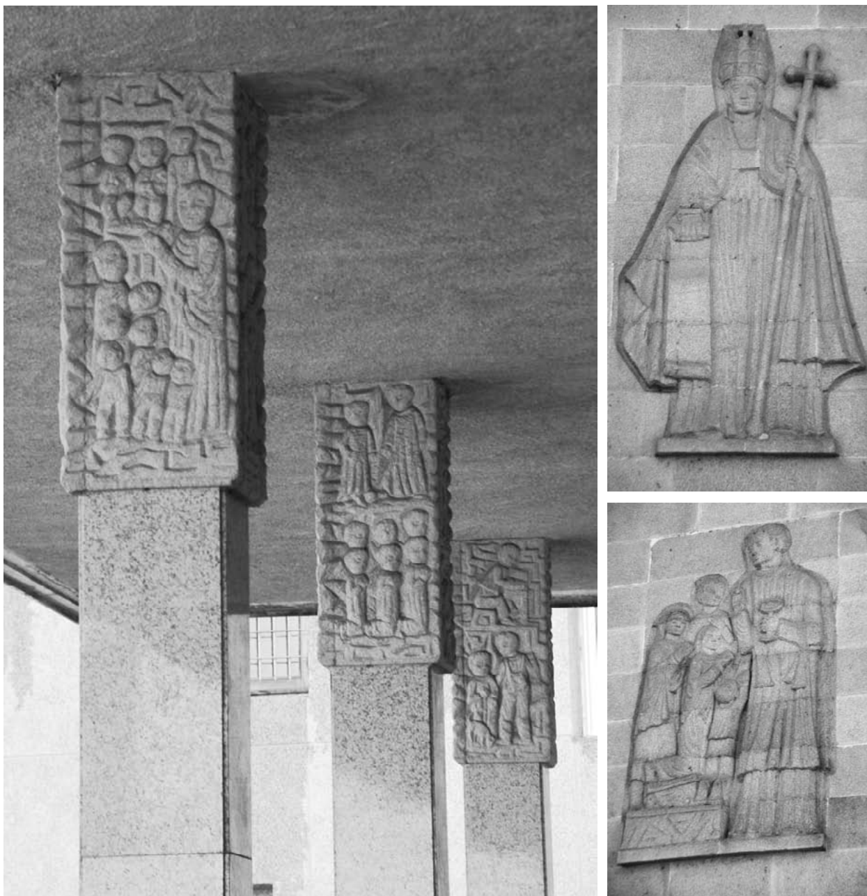
Capiteis e relevos do frontis da igrexa de Mariñamansa (1963).

de pé da tumba da familia Rodríguez Vilanova obra do grande escultor palentino Victorio Macho (1887-1966), obra anterior que de seguro inspirouno tanto a il cómo ó comitente que lle encargou a obra.