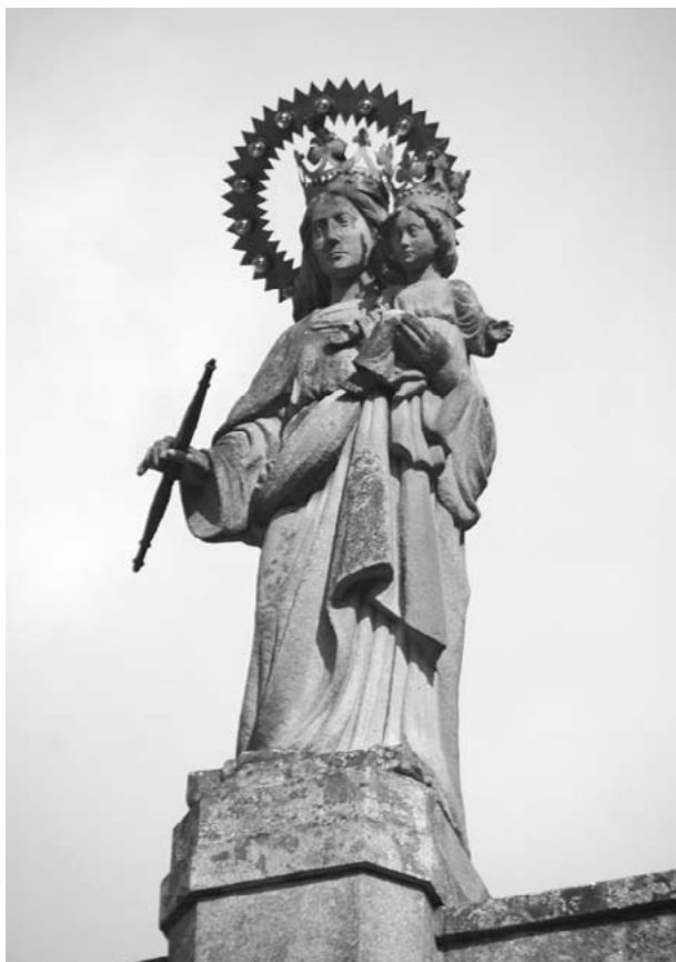
María Auxiliadora (1954).