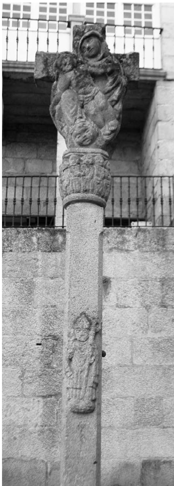
Cruceiro cabe do Museo arqueolóxico, na rúa Bispo Carrascosa (1961).

Nos anos seguintes hai máis obras públicas tradicionais. Así a do cruceiro cabe do Museo arqueolóxico, na rúa Bispo Carrascosa , de 1961, onde se escoita a voz plástica do gótico - renacentístico da parroquia na que naceu, o do adro da Trindade, coa figura do padroeiro San Martiño no varal. Ou o grupo dos pastoriños da aparición de Fátima , que axeonllados no medio do adro, rezan, co neno entre as nenas, mirando cara a escultura da Virxe. Aquí os planta no primeiro terzo de 1962. Están aquí antes da inauguración do altar maior a finais de abril de dito ano. Paralelamente o arquitecto Manuel Conde está tamén a facer a igreja de Mariñamansa , no S. da cidade, que se dedica ó Papa Pío X, novo santo