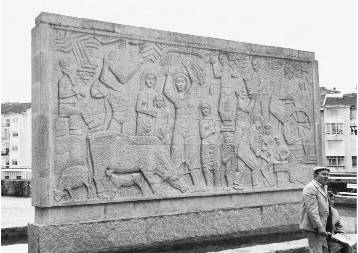
Mural para o pavillón da Casa de Campo (Madrid), boxe nos xardíns de Faílde.