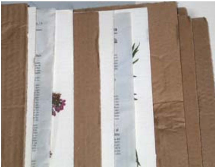
Figuras 1A y 1B

El proceso que seguimos para la preparación de los ejemplares es como sigue: las plantas recogidas en el campo se depositan en papeles de periódico, adjudicándoles un número de LOU inmediatamente. Se coloca cada pliego en la prensa separado de los contiguos por planchas de celulosa y cartón corrugado ( figuras 1A y 1B ). La prensa se coloca en el interior de una bolsa plástica; la prensa con los pliegos y cartones asoma por un extremo ceñido por el plástico ( figura 2 ) y por el otro unido a la bolsa hay un pequeño extractor ( figura 3 ), que mueve un caudal de unos 60 m 3 de aire por hora, a temperatura ambiente. Se mantiene el extractor encendido entre 24 horas y siete días, en función de la temperatura ambiente y la humedad de la dependencia, las especies o el número de ejemplares. Con este sistema las plantas secan antes, mantienen más fielmente los colores y no es necesario cambiarlas a diario de camisa para evitar que se pudran.