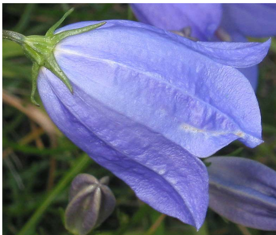
C. Ortigueira. Monte bajo. 2-VII-2005