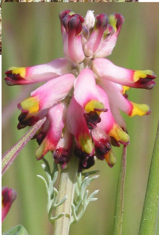
Ou. Rubiá. Campos en substrato calizo. 8-IV-2004