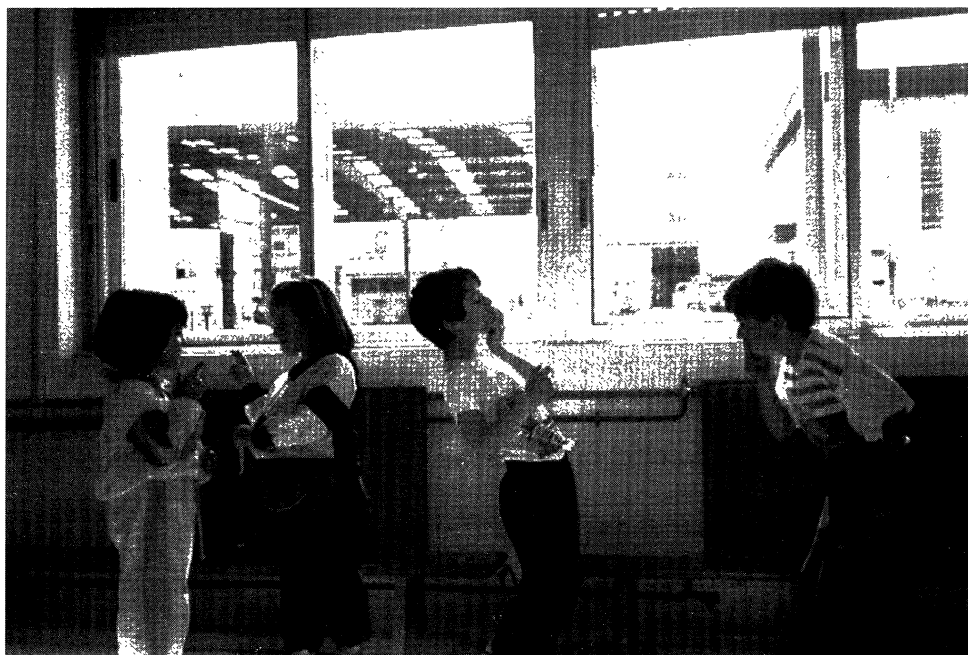
Nenos e nenas de Primeiro Ciclo de Primaria representando un home cun gran bandullo e fumando un puro