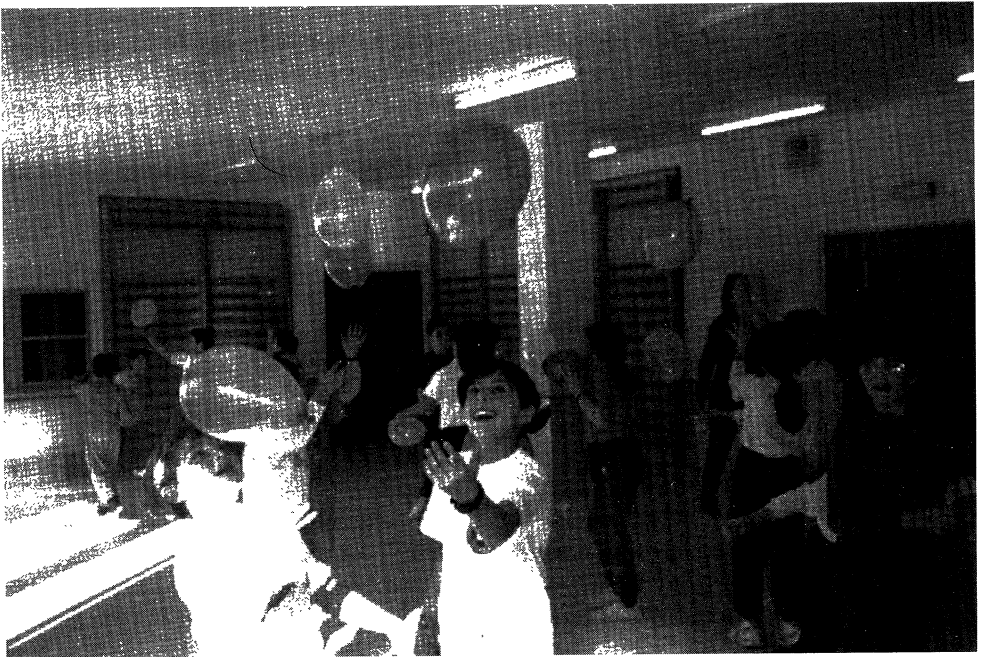
Nenas e nenos de Segundo Ciclo, na segunda sesión da unidade adicada a representación de situacións con globos.

A instalación na que se desenvolveron as sesións foi sempre do mesmo tipo: un ximnasio con fiestras ó exterior, no que o chan é duro e algo frío. Aínda que non se cumprían as condicións ideais, por desgracia, tampouco contabamos con outras posibilidades. Decidimos que era mellor levalo a cabo alí, ca non facelo.