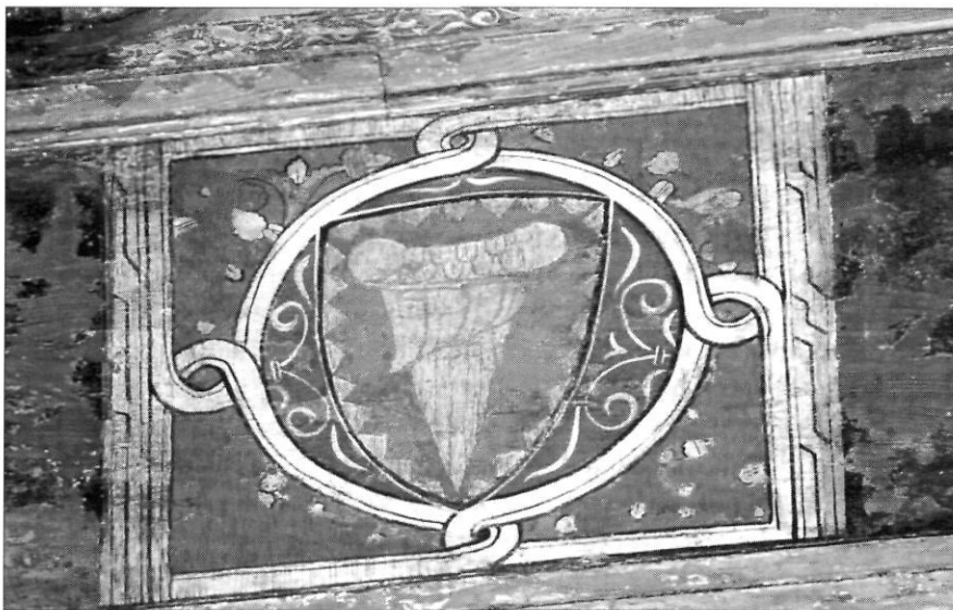
Escut de format gran, pertanyent a la família Marçal.

L'actual estat de degradació de la policromia amb prou feines mostra algunes restes de pigment verd fosc a les jàsseres i bigues soleres. Les motllures es decoraven amb sanefes blaves i amb motius vegetals blancs a l'interior. També els tapajunts mostraven una decoració en forma de dents de serra.