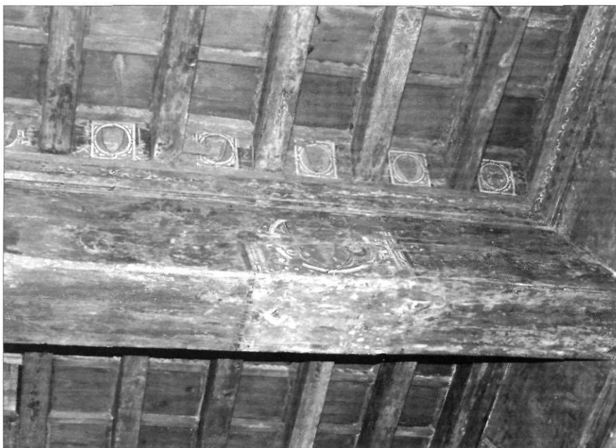
L'escut gran, a la jàssera; els escuts mitjans decoren les plaquetes situades entre les biguetes.