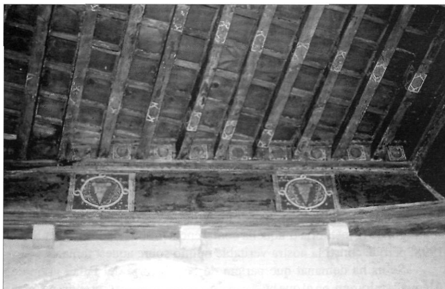
Dos escuts grans dels Marçal a la biga solera meridional; escuts mitjans de les plaquetes, i escuts petits sobre les cares vistes de les biguetes.

1339, gràcies al qual es bastí una capella a l'església de Santa Maria de Montblanc, amb un bonic retaule de pedra, així com una església hospital que es posà sota el títol de sant Jaume i sant Marçal. No descartem que després de la desaparició dels descendents o hereus de Jaume Marçal l'edifici passés a altres llinatges, entre els quals hi podria haver hagut el dels Alenyà o el dels Conesa, aquest darrer documentat amb certesa. Però l'emblemàtica construcció fou bastida, sense cap mena de dubte, per la família Marçal. 1