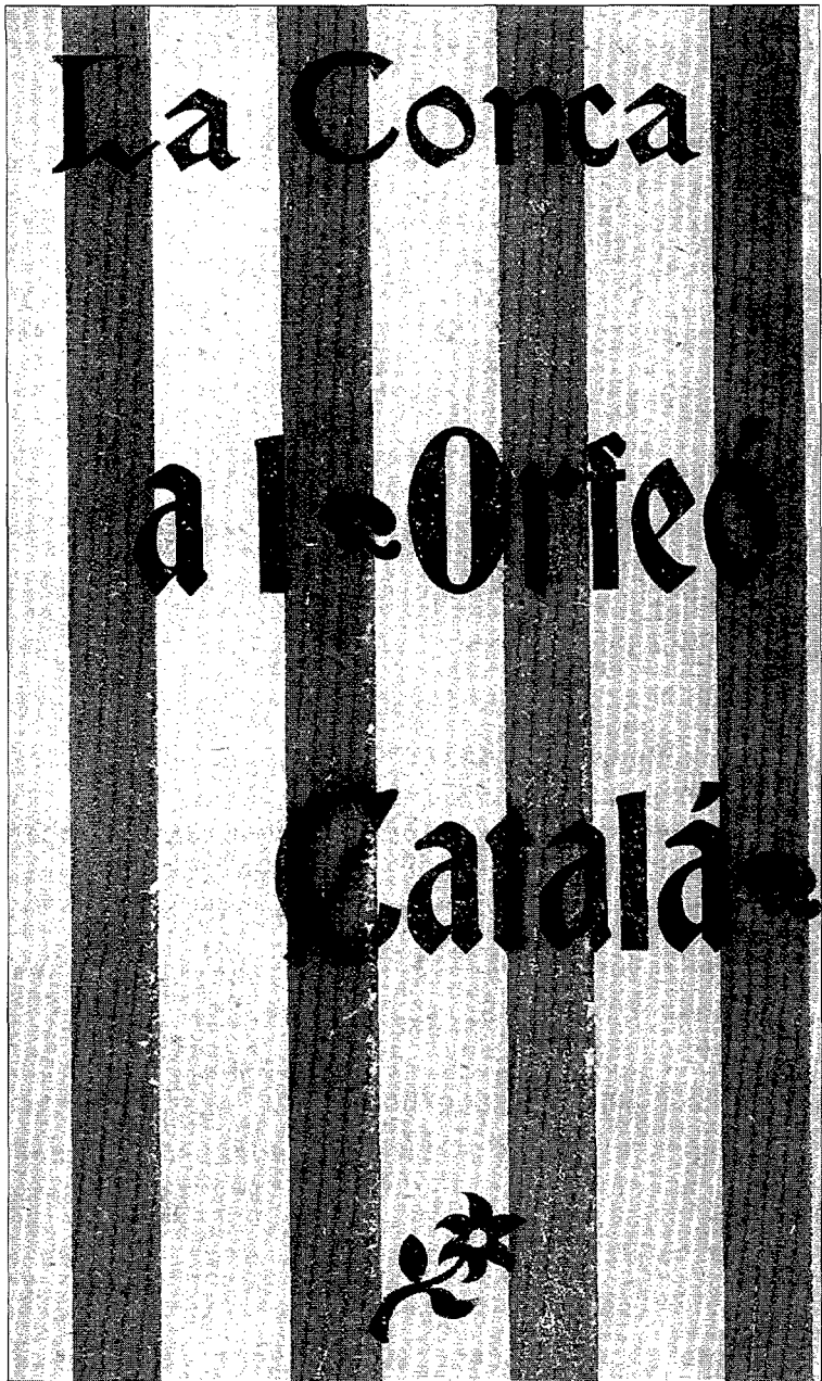
Portada de l'opuscle que la Conca de Barberà dedicà a l'Orfeó Català, l'any 1906.