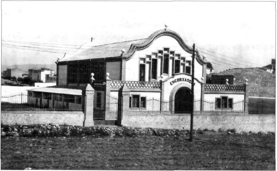
L'escorxador municipal, obra "faraònica" realitzada per les autoritats locals del període primo-riverista

admetre a les aules alumnes que no estiguessin vacunats o que patissin alguna malaltia contagiosa.