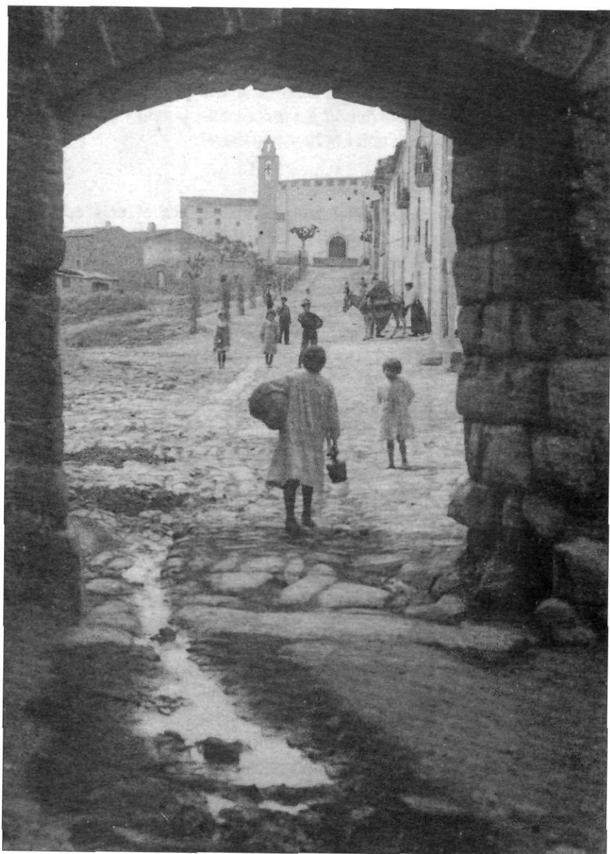
El Portalet de la Serra canalitza l'entrada a Montblanc de les aigües provinents del torrent Regina. Fins a finals del segle passat aquest torrent fou l'única claveguera de la vila