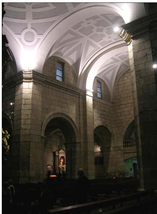
■ Lám. 2. Felipe de la Cajiga. S. Marcelo de León. Interior.