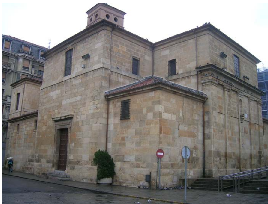
■ Lám. 3. Felipe de la Cajiga. S. Marcelo de León. Exterior