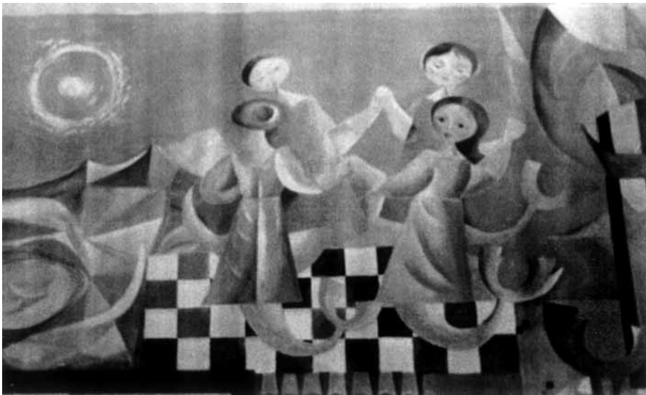
7 y 8. Murales pintados en su residencia de Cabo de Palos