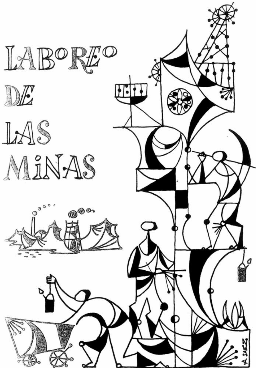
5. La dura vida del minero