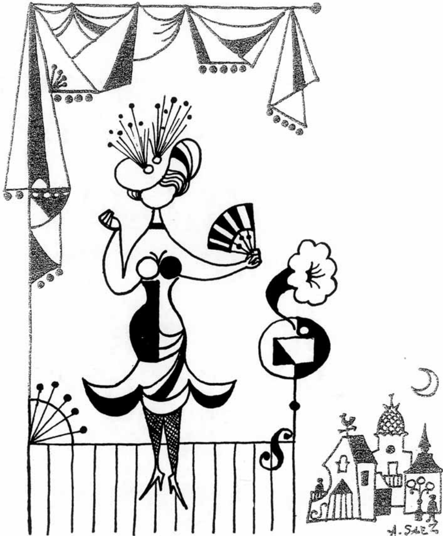
4. La Unión la nuit