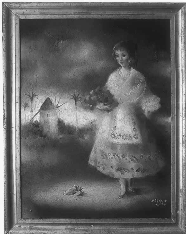
1. Óleo sobre indumentaria del Campo de Cartagena, ilustración para una obra etnográfica de J. Mas

Jorge Aragoneses, M. Pintura decorativa en Murcia, siglos XIX y XX . Murcia, 1964.