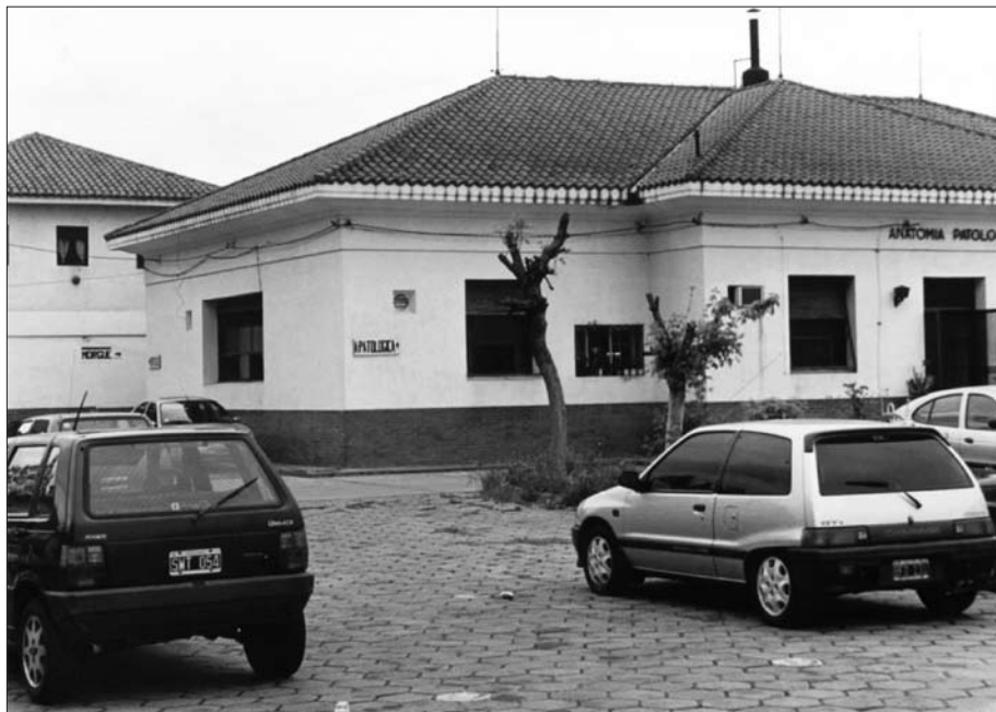
Figura 3. La playa de estacionamiento y los edificios de Anatomía Patología y la Morgue.