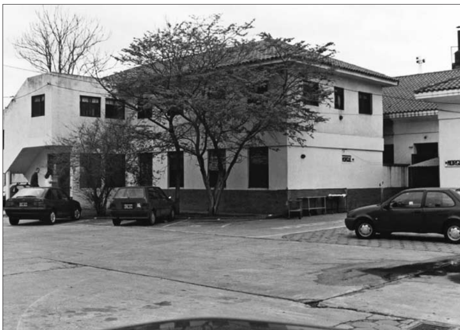
Figura 4. A la izquierda, el edificio en el que funcionaban los Consultorios Externos. A la derecha y lindante, la Morgue.