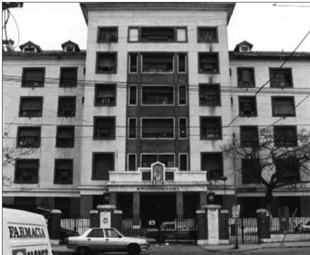
Figura 2. Frente del Hospital "Evita" en 2001. La Sala de Internación funciona en el segundo piso.