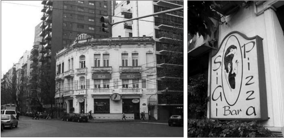
Figura 1. El café "Sigi", en la zona llamada Villa Freud, en el barrio porteño de Palermo. A la derecha, una vista ampliada de su letrero principal.