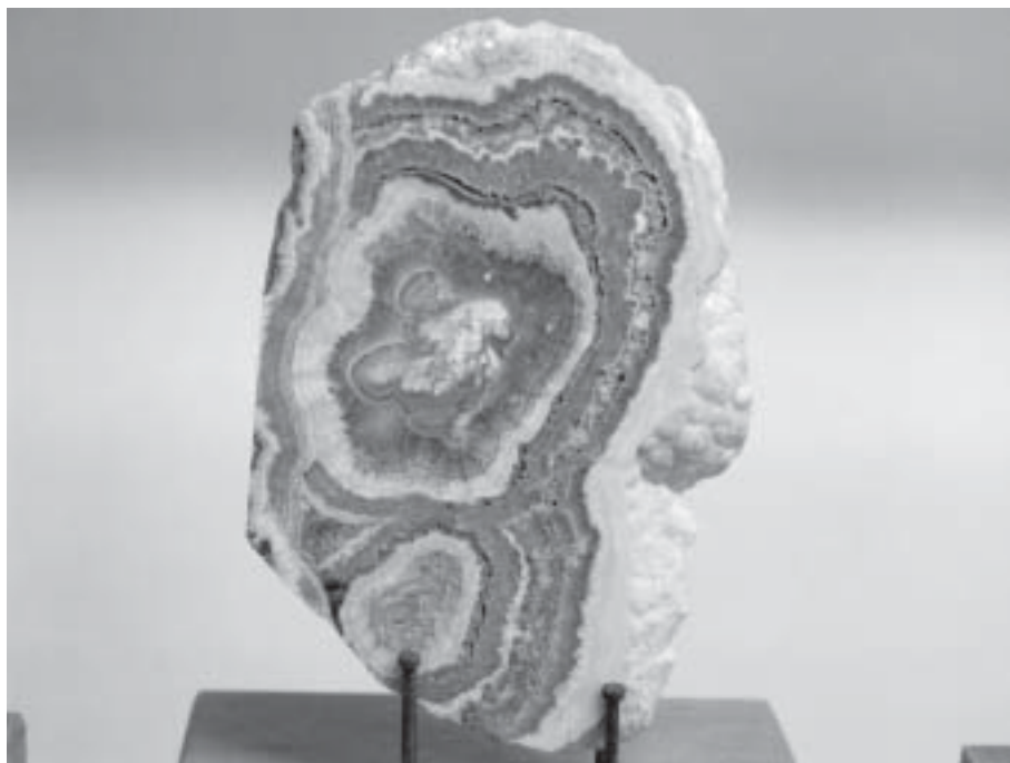
Rodocrosita de Méjico

tió un Taller de Minerales a varios grupos de Educación Secundaria Obligatoria y tuvo gran aceptación. A través de experiencias sencillas los alumnos y alumnas se divierten, aprenden y aumentan su interés por la Geología y por la protección del patrimonio natural.