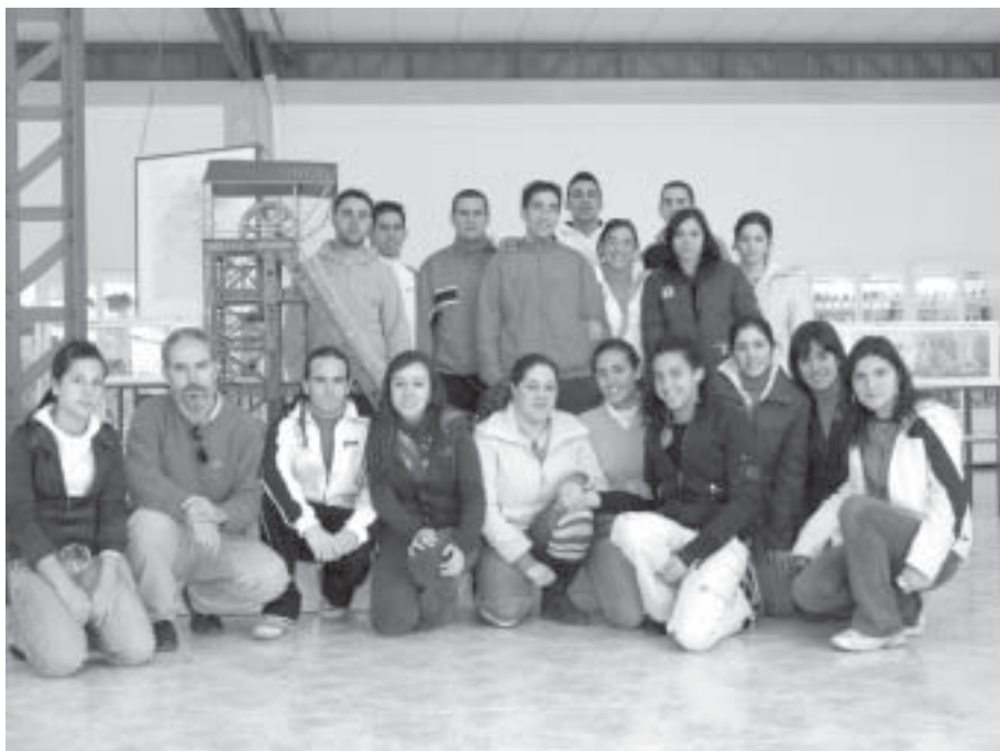
Alumnos y alumnas de Ciencias de la Tierra y del Medio Ambiente, del I.E.S. "Alto Guadiato", en el Museo

Pueblonuevo. El aniversario ha coincidido con la Resolución de 2 de abril del 2007, de la Dirección General de Museos, por la que se hace pública la relación de los Museos anotados preventivamente e inscritos en el año 2006 en el Registro de Museos de An-