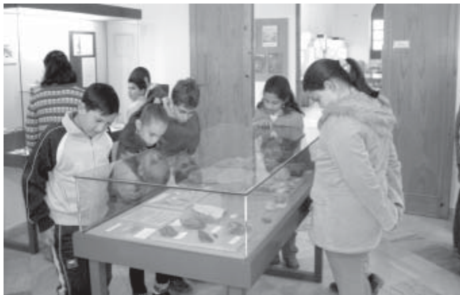
Visita de escolares al museo