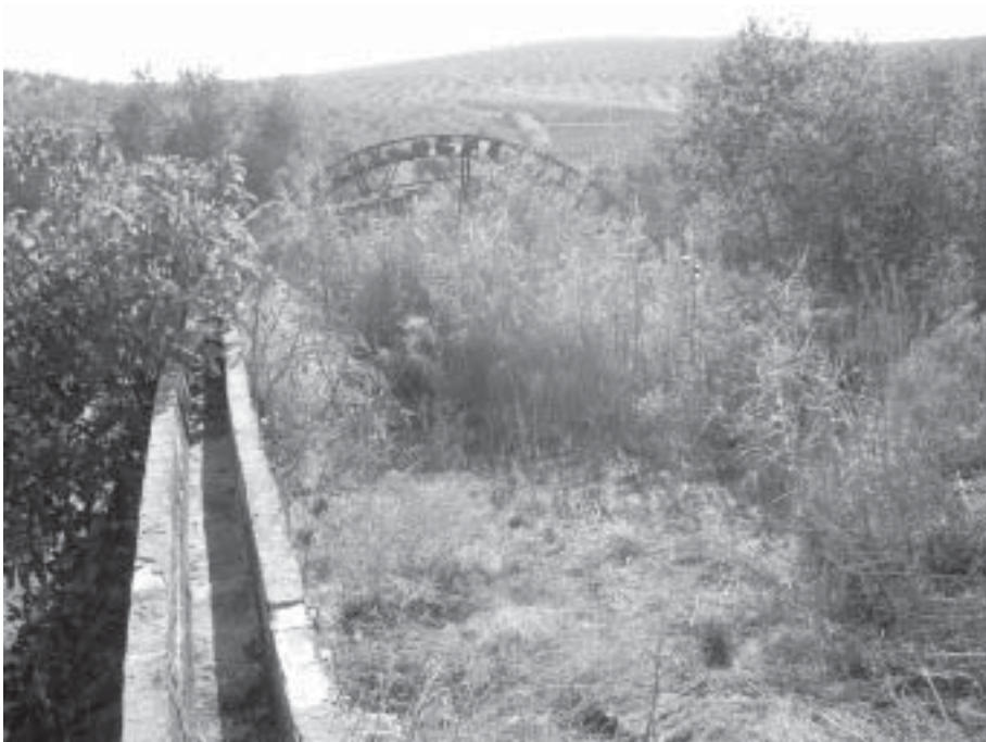
Almatriche y noria "El Rabanal"

Por último; la realización de movimientos de tierra en la zona norte de la población, próxima al casco urbano, por la realización de infraestructuras para suelo industrial se ha realizado diversas visitas con el fin de detectar posibles hallazgos arqueológicos ante los movimientos de tierra realizados para saneamiento, viales o parcelas.