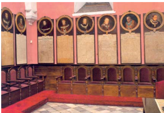
Retratos de los arzobispos en la sala del Cabildo en la catedral de Lima.

De la contribución del Arzobispo a las reformas de la catedral queda constancia en la leyenda escrita al pie del retrato de Barroeta que se guarda en su sala capitular. Así dice que “ Tuvo el dolor de hallar arruinada la Iglesia Catedral por el espantoso temblor de 28 de Octubre de 1746 ”. Se estrenó la mitad de ella con una función suntuosa, casi cuatro años después de su llegada a Lima, el 30 de mayo de 1756, con misa en medio de una gran pompa.