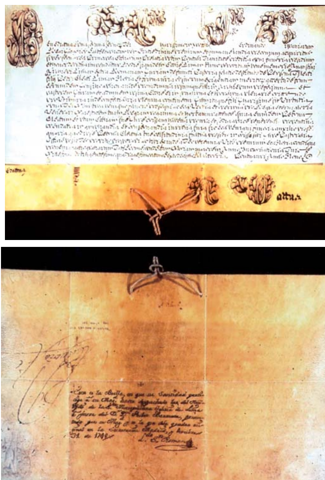
Anverso y reverso de la Bula de confirmación. Ministerio de Cultura. Archivo General de Indias. MP-Bulas y Breves 540.

a la iglesia parroquial, donde se conserva su retrato a tamaño natural. Asimismo benefició el santuario de nuestra señora de Allende, patrona de la localidad 9 , donde mandó construir dos capillas laterales al altar mayor, colocando en la parte superior su escudo de armas, de madera policromada. Y legó objetos de culto, dejando establecidas a su muerte dos capella-