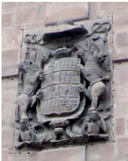
Casa solariega del arzobispo en Ezcaray.