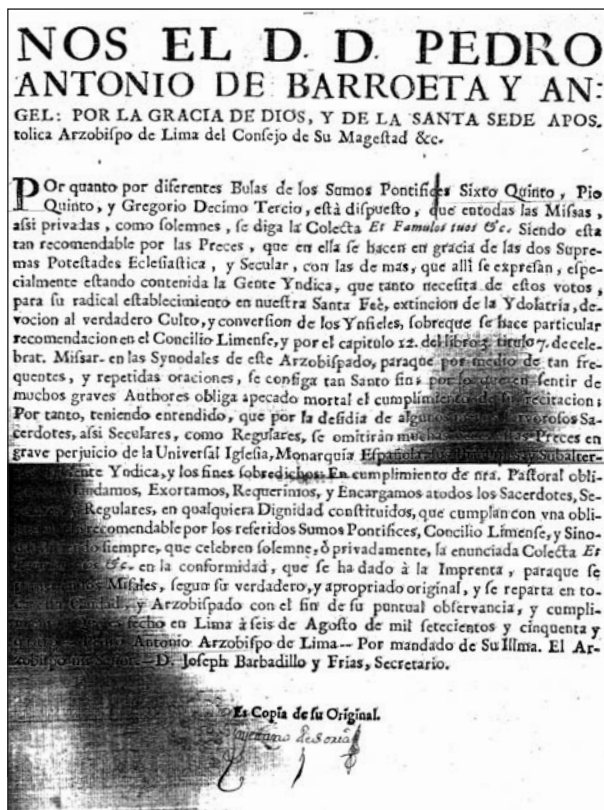
Edicto redactado por su mandato. Secretario Joseph Barbadillo y Frías. Lima 6-agosto -1754. Autenticada por Cayetano de Soria, notario mayor de la audiencia arzobispal.

Manda a los sacerdotes decir en la misa la oración llamada "Colecta Et Famulos tuos", que debía estar casi en desuso. La oración pedía por la familia real, al Sumo Pontífice y prelado, por el virrey, y otras súplicas, como confirmación de los indios a la fe católica, la paz, la salud, que se conserven los frutos de la tierra, etc. AGI. Lima 522.