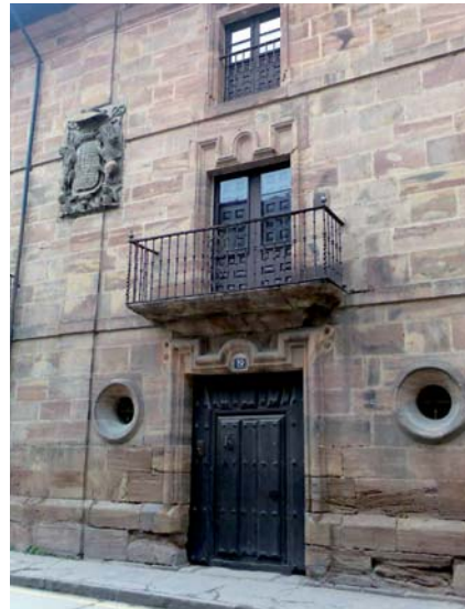
Casa solariega del arzobispo en Ezcaray.

El primero es un león rampante; el segundo, de losanjes; el tercero, un castillo; el cuarto, una espada entre cuatro alas (Ángel); el quinto, un caballero armado, con un árbol (encina o roble) enraizado del que pende una caldera (Zaldívar); el sexto, dos alas; el séptimo, ocho armiños; y el octavo, tres lises 12 . Lleva acolada la cruz patriarcal, y va timbrado con capelo arzobispal con sus correspondientes cordones anudados (aunque no se pueden ver claramente en el ejemplar de la fachada) con diez borlas (véase el grabado adjunto 13 ). Y, aunque no siempre se haga, esta composición puede añadir un escusón con las armas de la casa Solar de la Piscina 14 , muy extendidas en toda la Rioja y que dio ilustres diviseros que ocuparon importantes cargos eclesiásticos entre los siglos XVI y XVIII, como obispos, capellanes reales, comisarios de cruzada, vicarios, presidentes de órdenes, etc.