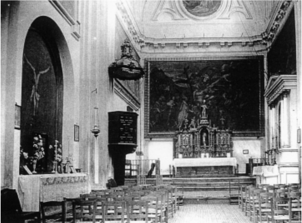
Interior de la iglesia hacia los años veinte del siglo xx.