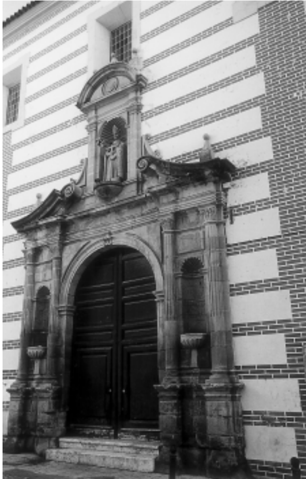
Fachada principal de la iglesia de San Julián.

En la prensa local 77 sólo hemos hallado dos misas celebradas en el año 1976 78 .