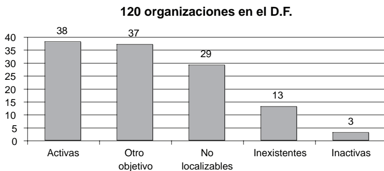
Gráfica 1 Universo de organizaciones del VIH-SIDA en el Distrito Federal

Así, son 38 las OC mexicanas dedicadas exclusivamente o principalmente al trabajo en VIH-SIDA en el Distrito Federal activas y localizables en 2006.