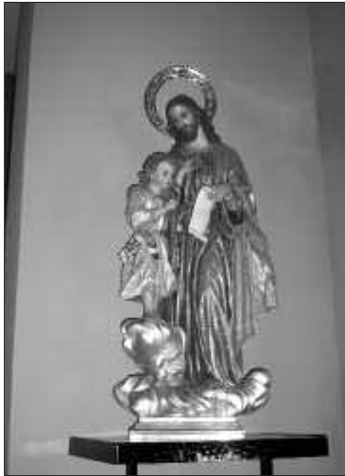
“San José enseñando a leer al Niño” (Colegio Siervas de San José, Palencia)

deró un privilegio, sino un derecho. Proporcionarla es, por tanto, un acto de caridad y la presencia de San José en su faceta de padre y maestro adquiere ahora más significado que nunca. Como resultado, la iconografía de “San José enseñando al Niño” , quedó recuperada para la Historia del Arte.