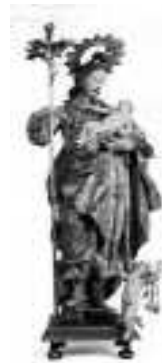
“San José” (Carmelitas de Palencia)

No vamos a detenernos ahora en las fuentes evangélicas donde queda patente cómo la vida de San José fue un continuo servicio a