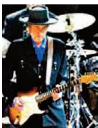
Figura 8. Metáfora 8: A Bob Dylan lo que le gusta es cantar.

La situación sería comparable a pedirle a Bob Dylan, quien obviamente disfruta enormemente encandilando desde el escenario a miles de personas en sus conciertos (Figura 8), que se bajase del escenario para organizar el público en grupos de tres o cuatro personas, repartiéndose guitarras y fuese visitando los grupos a ver cómo va la cosa.