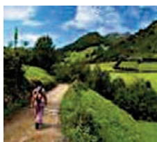
Figura 7. Metáfora 7: La calidad no es un destino sino el camino.

dicho: “La calidad ( en este caso, la calidad docente ) no es un destino sino que es el camino”.