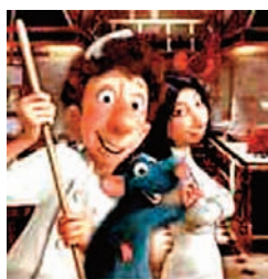
Figura 10. Metáfora 10: Un verdadero trabajo en equipo.

En el restaurante hay camareros y cocineros. Los cocineros no suelen salir al salón a servir platos, porque pueden causar mala impresión con sus ropas probablemente manchadas de grasa. Y los camareros evitan entrar en la cocina, no vayan a manchar su uniforme. No obstante, acabada la jornada, camareros y cocineros charlan un rato juntos. Los camareros comentan cuáles han sido los platos más apreciados por los clientes, y los cocineros comentan las novedades que están preparando para el menú del día siguiente. En fin, un trabajo en equipo (aunque también es cierto que hoy en día es más fácil lograr fortuna y gloria trabajando como cocinero que como camarero) (Figura 10).