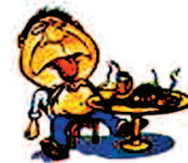
Figura 2. Metáfora 2: Por si no tuviéramos bastante, ahora un trabajito.

La dieta 2 . Un hombre muy obeso fue a la consulta del médico. Éste le dijo que no podía seguir así y le puso a dieta. Al poco tiempo el hombre murió. El doctor asistió al entierro y le preguntó a la viuda sobre las circunstancias de la muerte. Ella le contó que en las últimas semanas su marido había adquirido un hábito extraño. Resulta que después de comer lo mucho que comía siempre, sacaba un papel y decía: “bueno, ahora vamos a por la dieta que me dio el doctor” (Figura 2).