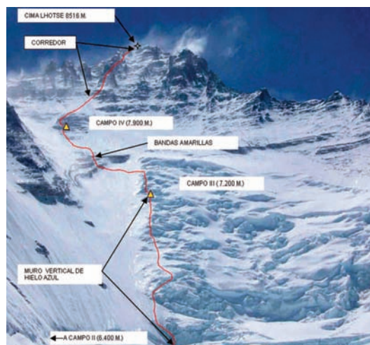
Figura 5. Metáfora 5: Cuanto más ambicioso es el objetivo más necesario es un plan paso a paso.

Así pues, la ausencia de un plan detallado paso a paso, de lo que deben hacer nuestros alumnos en la asignatura nos impide conseguir retos realmente ambiciosos con ellos.