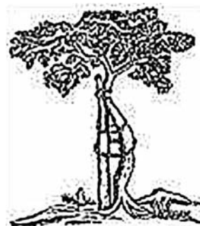
Figura 4. Metáfora 4: Primero guiar para después dejar más libertad.

El árbol recién plantado. De acuerdo con el modelo que defendemos, el profesor debe planificar con detalle la secuencia de actividades y entregas que debe realizar el alumno dentro y fuera de clase, hasta cubrir las horas de dedicación establecidas para nuestra asignatura, en virtud de los ECTS asignados. En otras palabras, debe diseñar ese camino que conduce inexorablemente al aprendizaje.