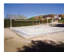
Figura 9. Metáfora 9: A qué vamos a jugar: a tenis, a baloncesto o a voleibol.