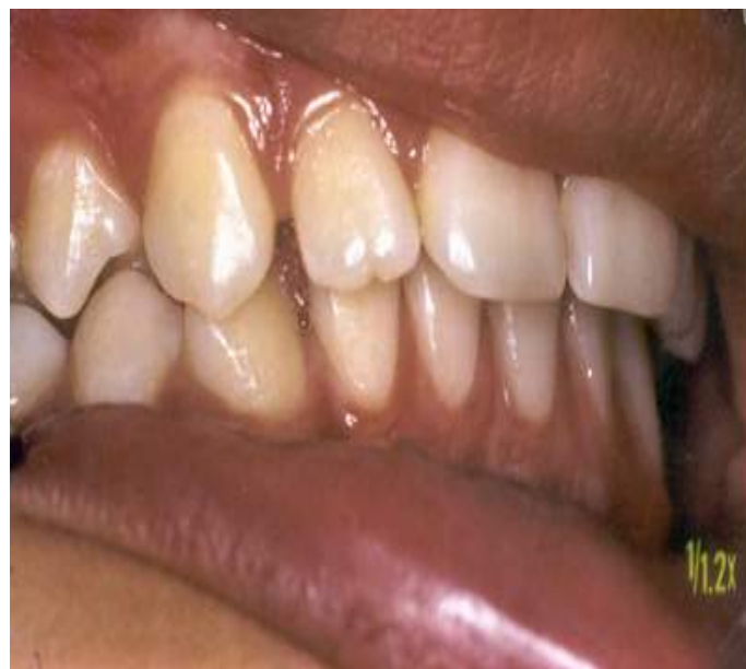
Figura 3. Oclusión después de 8 meses de tratamiento con las pistas.

Las pistas actúan en los tres planos del espacio indicado en el tratamiento temprano de las Clases I, II, y III de Angle, de fácil construcción y adaptación por parte del paciente.