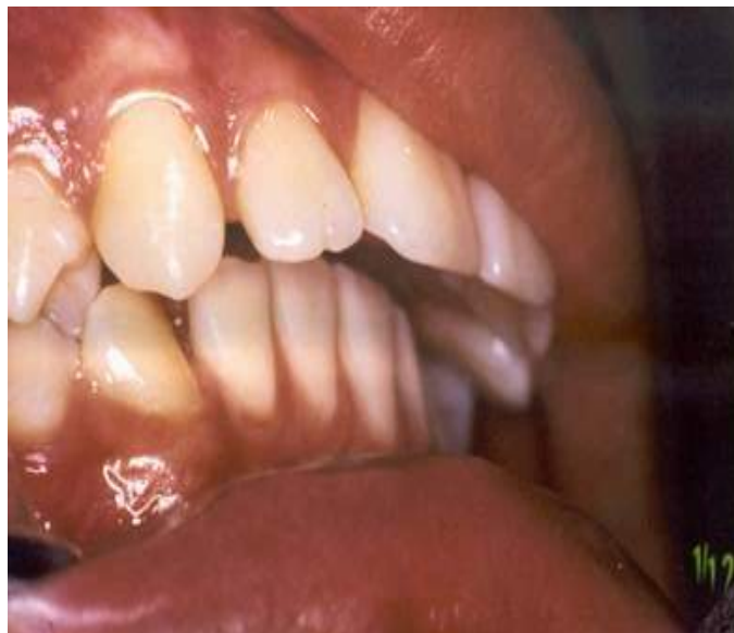
Figura 1. Oclusión antes del tratamiento.

En cuanto al diseño de las pistas, en el arco superior