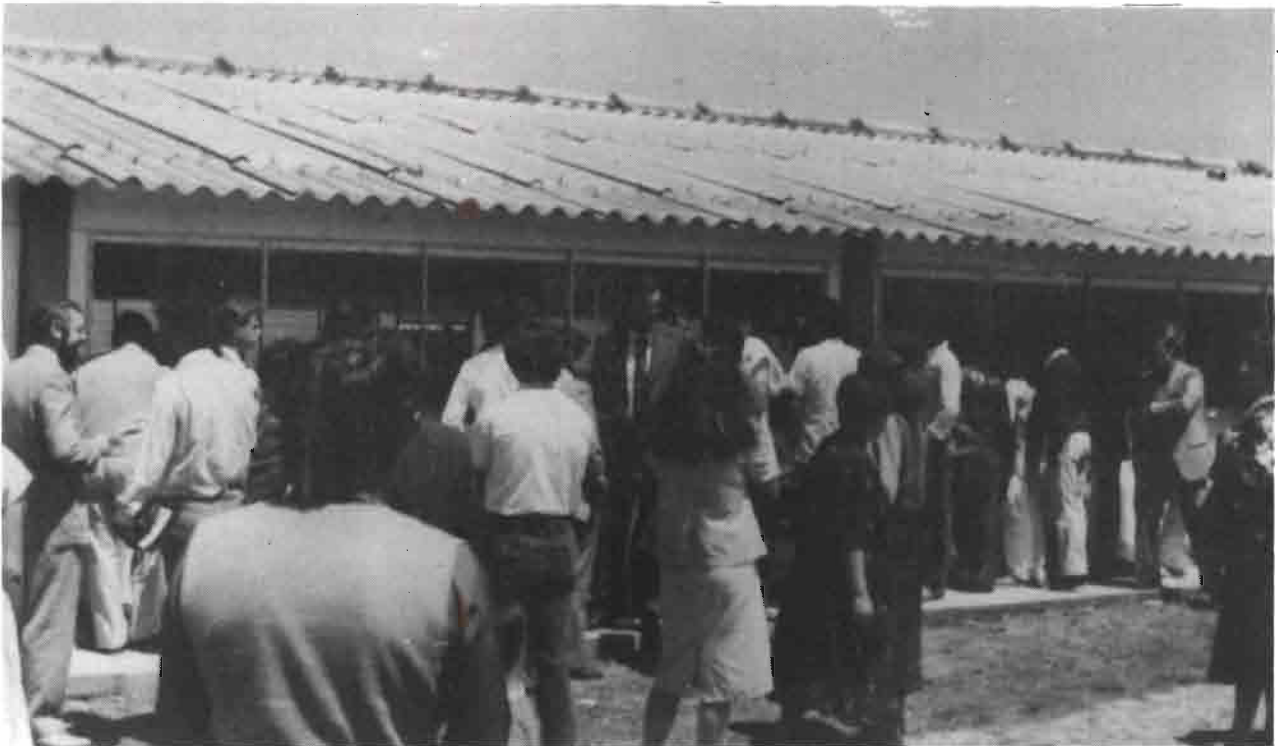
Inauguración del Centro: COCICEMAC.