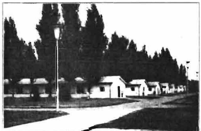
Naves de maternidad

Gracias a la participación del Dr. Darabant de la compañía Cyanamid Viena, el grupo de españoles que asistimos al 4º Congreso Mundial de Cunicultura, tuvimos la oportunidad de visitar la Cooperativa Petöfic en la población de Dunavarsány próxima a la capital, Budapest. Esta cooperativa contiene la que es probablemente la mayor granja cunicola de Europa, y entre las primeras del mundo en cuanto a capacidad de conejas en producción, pues alcanza la cifra de 10.000 jaulas de reproductoras.