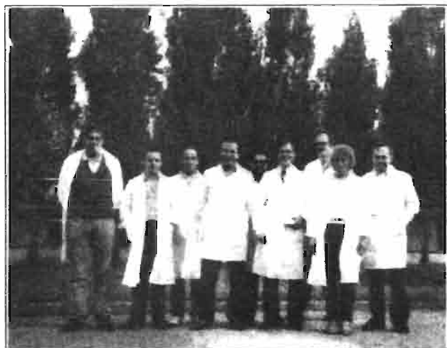
La delegación española durante la visita a las instalaciones, junto a los miembros de la cooperativa.

Los principales problemas patológicos de esta etapa son la pasterolosis y la mamitis.