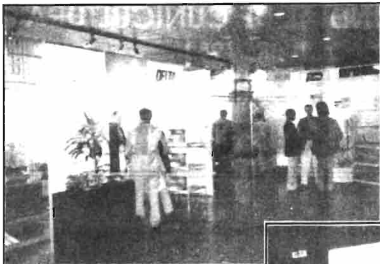
Numerosos congresistas visitaron la exposición de material.