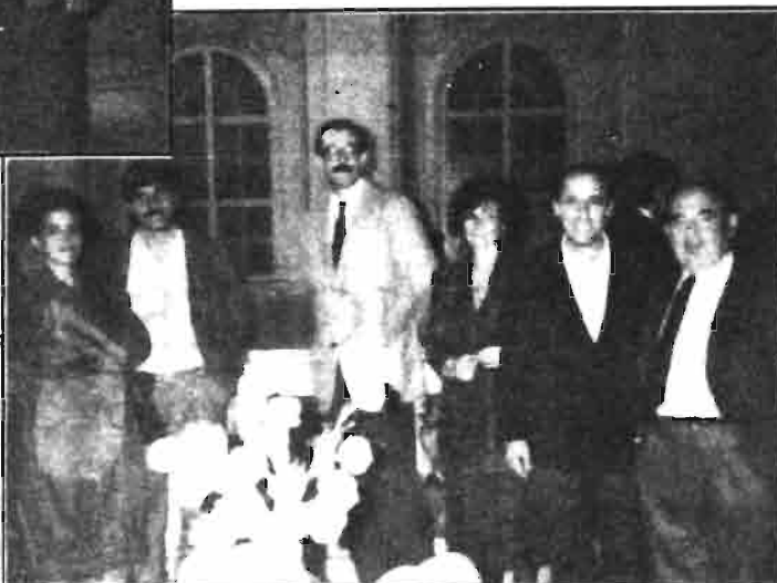
Los asistentes españoles, durante una de las recepciones ofrecidas por la Organización del Congreso.

futuros en la investigación sobre la nutrición de conejos de producción intensiva.