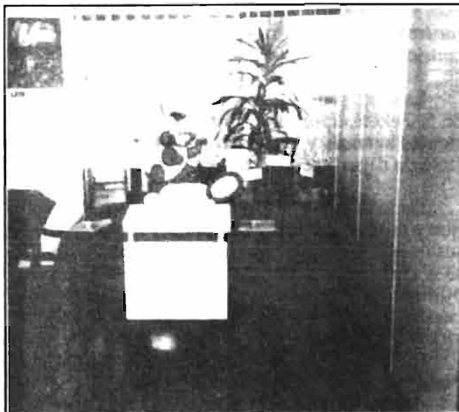
Visita del Stand EXTRONA único fabricante español participante en la exposición que se desarrolló conjuntamente con el Congreso.