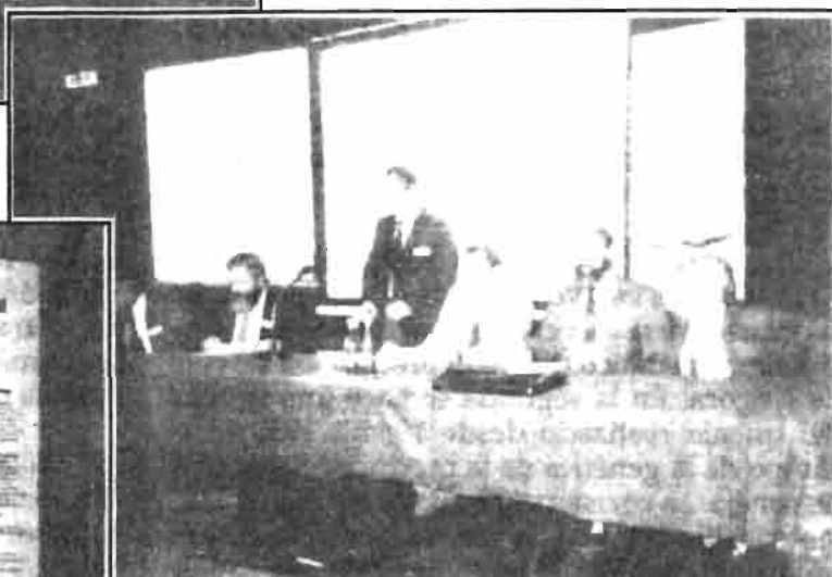
Miembros de Junta de la W.R.S.A. durante la celebración de la Asamblea General.

dos espléndidas recepciones. La primera, se celebró en el Museo de Agricultura, ofrecida por el ministro de Agricultura; después de la cena se pudieron visitar las importantísimas exposiciones del museo. La segunda, fue una cena de despedida celebrada en el propio centro de convenciones, que estuvo precedida de una gala lírica ofrecida por la Orquesta de la Ópera de Budapest y sus principales solistas.