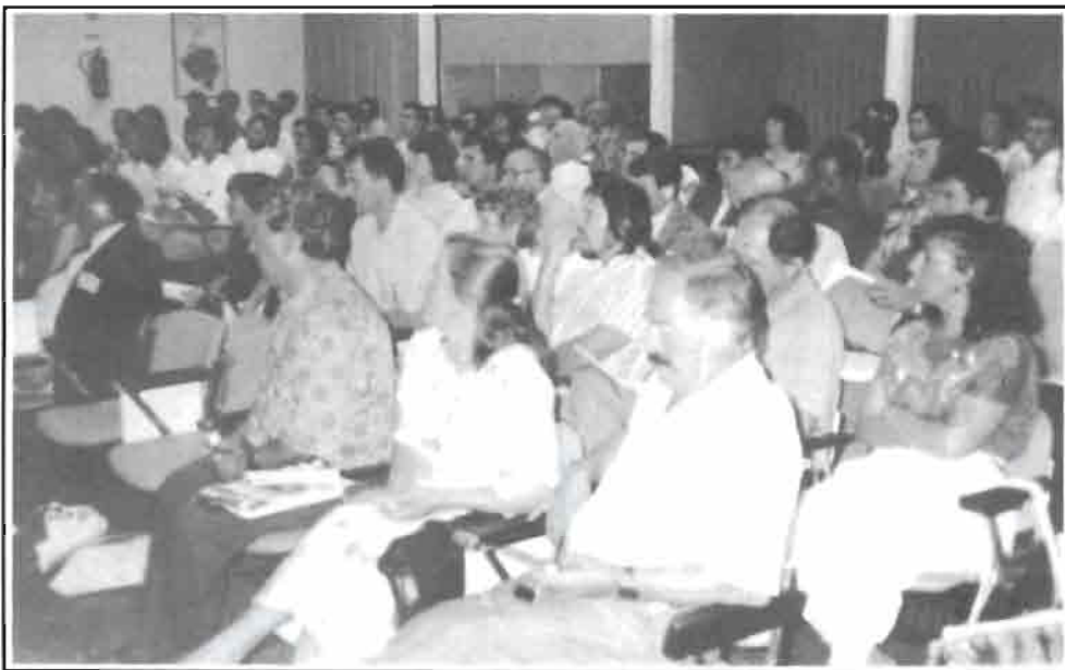
El público asistente a las sesiones de trabajo del XV SYMPOSIUM

Consejero de Agricultura, Ganadería y Pesca de la Comunidad Autónoma de la Región de Murcia