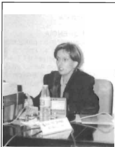
La Sra. Roselló durante la ponencia inaugural con el título: "El conejo Carne alternativa y de calidad".