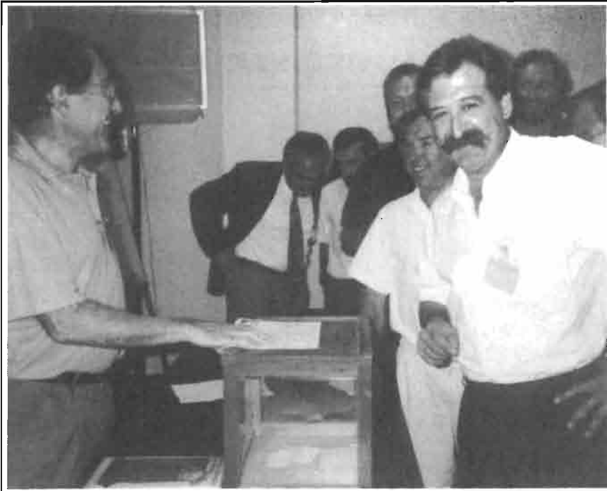
Los socios de ASECU en el momento de la votación.