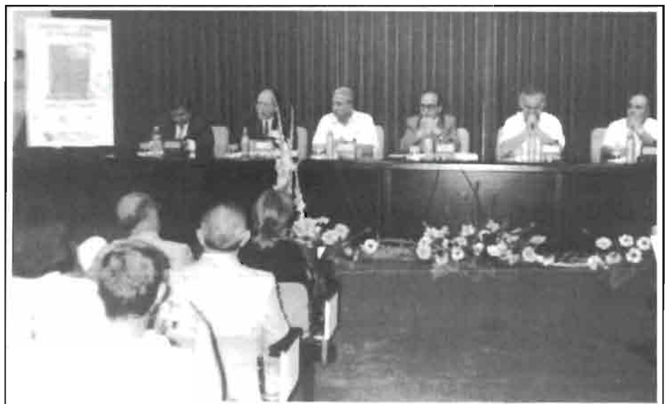
Las autoridades locales y el presidente de ASESCU durante el acto de inauguración del XV SYMPOSIUM DE CUNICULTURA