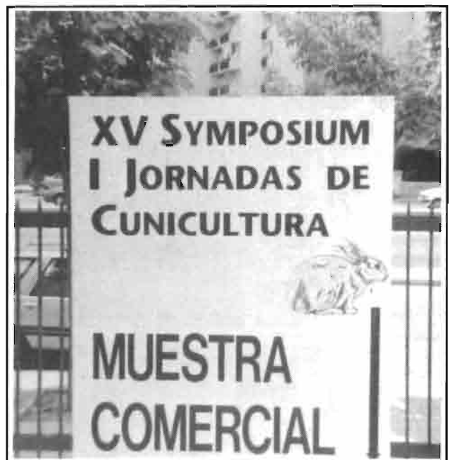
Junto a la Sala de reuniones se organizó la tradicional muestra comercial.