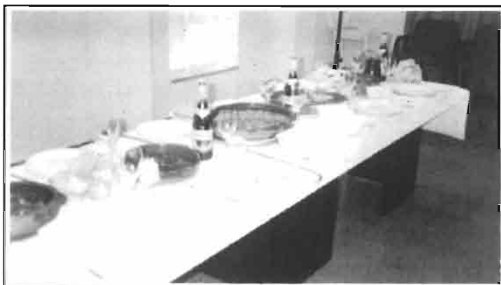
Como cada año no pudo faltar el concurso gastronómico.