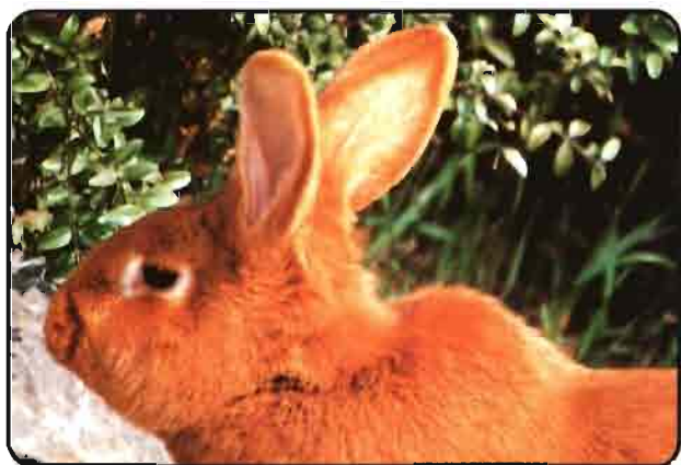
LEONADO DE BORGOÑA (Fauve de Bourgogne)