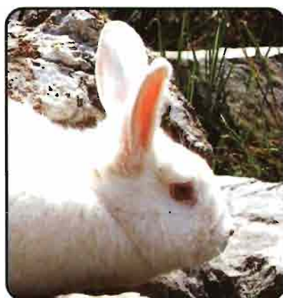
NEO ZELANDES (New Zeland)