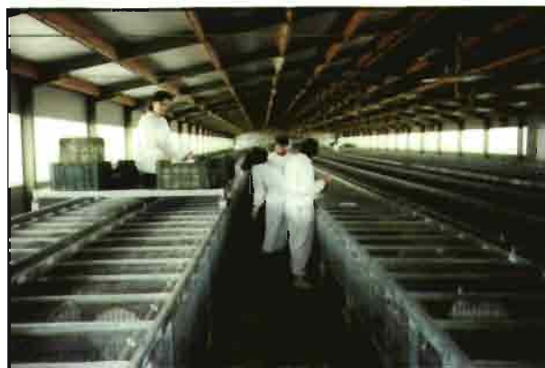
Plataforma corredera sobre los trenes de jaulas, este elemento auxiliar evita tener que desplazar un carro entre las hileras de jaulas.