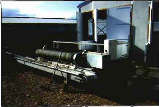
Recogida de las deyecciones con traslado mediante una cinta, que permite la carga en un camión o remolque.