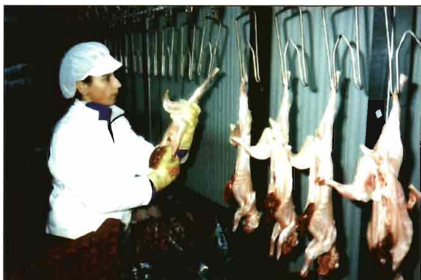
Embalaje de canales destinadas a la comercialización.

en cada una de las naves hay 100 machos reproductores para la monta natural, en tanto se perfecciona la técnica de la inseminación artificial.