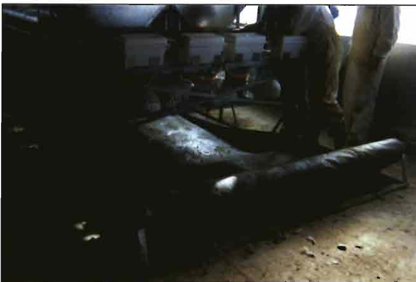
La eliminación de las deyecciones se verifica con una cinta transportadora móvil, su gran longitud a veces genera problemas.