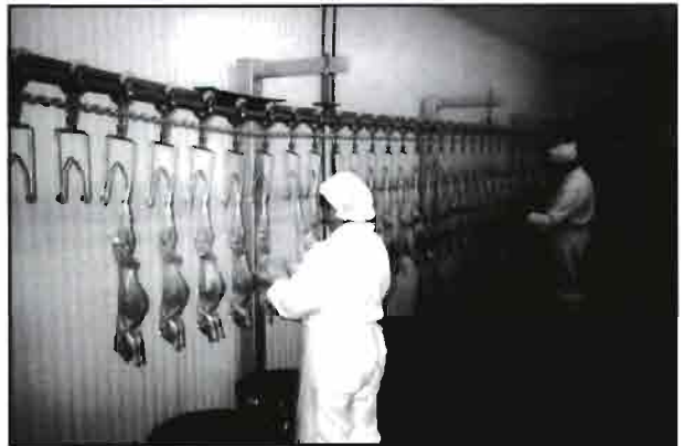
Proceso de faenado. Evisceración.

partos, nidos y nueva cubrición en común-, la nave C estará ocupada con 1.692 hembras paridas hace una semana, en la B las paridas hace dos semanas, que deben palpase, las nave A las que parieron hace tres semanas... En la nave M se van trasladando las 1.692 hembras hacia la nave F en cuanto van destetándose sus camadas, y así completando la rueda.