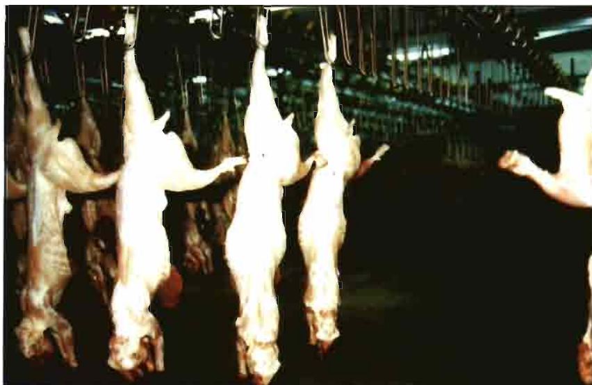
Cámara de oreo del matadero