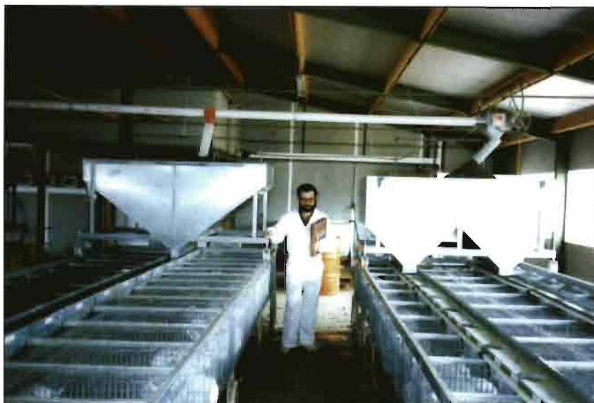
El pienso es distribuido mecánicamente mediante unas tolvas de gran capacidad, deslizantes sobre las jaulas.

Actualmente existe una UNIDAD DE EXPLOTACION formada por 14 naves iguales, en condiciones de ambiente natural asistido por termorreguladores que accionan extractores, abren y cierran ventanas -tipo guillotina- y ponen en marcha las estufas en invierno. Otra UNIDAD DE EXPLOTACION igual (14 naves más), está terminándose de construir a 500 metros de la primera, estando ya ocupadas por conejas algunas naves. O sea, en breve habrá 28 naves construi-