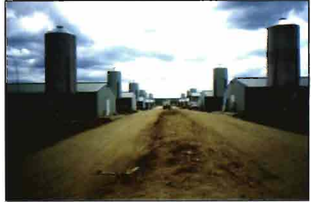
Unidad 1. Calle principal; en total son 14 naves de 90 m., cada una con su silo y servicios independientes.