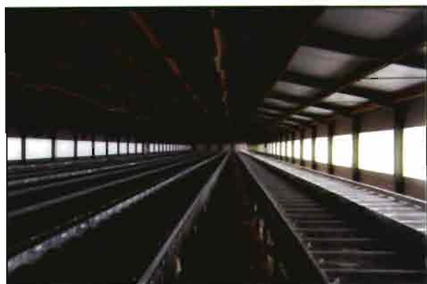
Interior de una de las naves, con 90 m. de longitud y 12 de anchura, con una capacidad de 1.692 hembras.