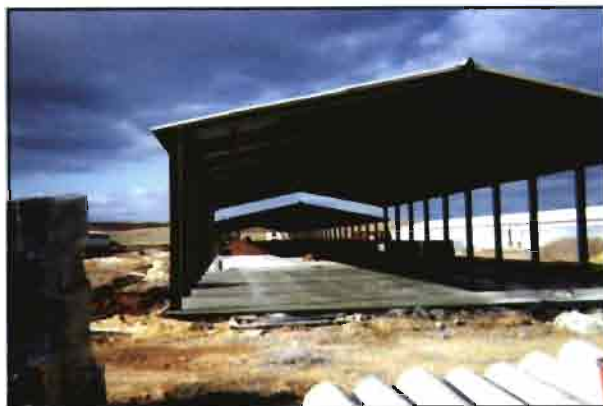
Una de las 14 naves en construcción correspondiente a la unidad 2.