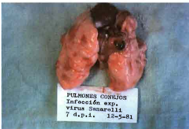
Pulmón seriamente afectado por el virus mixomatoso en su forma respiratoria.

Generalmente afecta a conejares cerrados, y presenta un periodo de incubación prolongado -de 1 a 3 semanas-. Afecta al ojo (tumefacción), órganos genitales, orejas y aparato respiratorio, siendo mortal si existe la colaboración de gérmenes oportunistas ( Pasteurella , E. coli , Streptococcus spp). En determinados animales puede ocasionar abortos, esterilidad, y problemas reproductivos). En las formas graves provoca obstrucción nasal y disnea por oclusión.