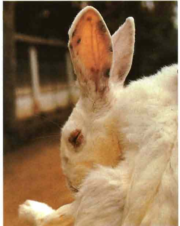
Manifestación de lesiones cutáneas benignas, que determinan a la larga vesículas y costras, estas lesiones causan prurito y a veces sobreinfecciones cutáneas.