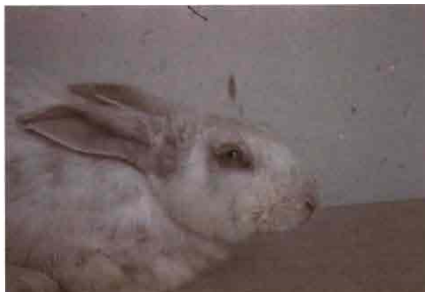
Aspecto característico de mixomatosis crónica, con conjuntivitis y síntomas de rinitis. Esta forma afecta fundamentalmente a la base de las orejas y ojos.