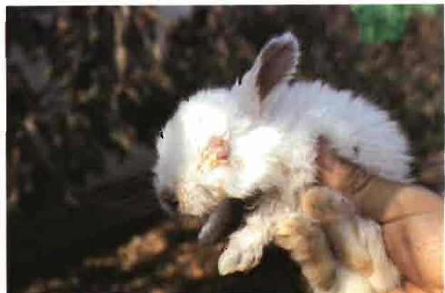
En los gazapos lactantes, la mixomatosis afecta con frecuencia a los ojos, causando blefaro conjuntivitis.