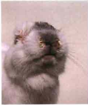
Forma de rinitis por mixomatosis. Las manifestaciones de rinitis suelen complicarse con otros microorganismos causando disnea y asfixia.