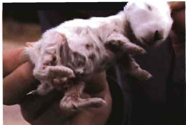
Nódulos de mixomatosis en gazapos lactantes, en la enfermedad en su forma crónica.

Las explotaciones industriales tienden a presentar la mixomatosis en forma latente, especialmente cuando existe en la granja un cierto nivel de protección. En estos casos se tiende a producir un equilibrio muy precario que puede ser alterado, cuando se producen alteraciones en el manejo, o sobreviene cualquier problemática secundaria, o incluso en el destete. La reaparición de la mixomatosis atípica puede surgir, al poco tiempo de producirse una elevación transitoria de la viremia (véase el esquema de este hecho en el encabezamiento de esta página)