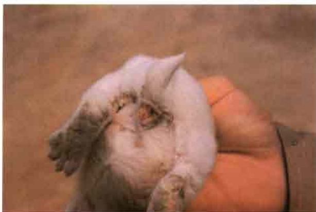
Lesiones mixomatosas de tipo genital externo, con tumefacción vulvar muy característica.