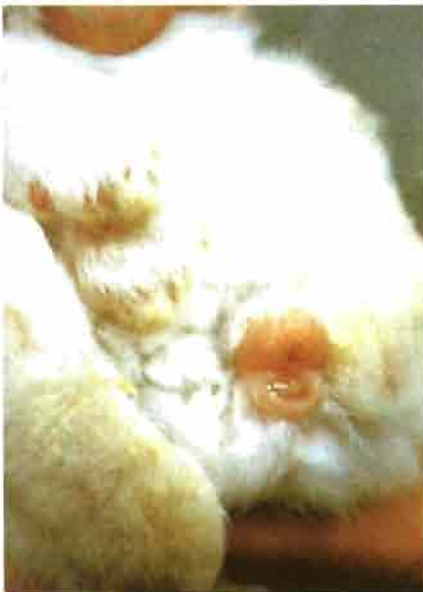
Aspecto característico de la tumefacción ano-vulbar en conejas reproductoras.

La aplicación de estas vacunas en animales carentes de anticuerpos provoca una inmunodeficiencia transitoria, que podría ser inadecuada en animales con problemas sub-clínicos; es por ello, que recomendamos encarecidamente a los cunicultores consultar con el veterinario que lleve la dirección sanitaria de la granja sobre cual es el programa de vacunación individualizado más idóneo para cada explotación .