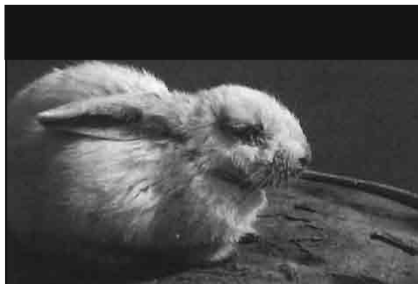
Aspecto clásico de la mixomatosis, con nódulos faciales, hinchazón de los párpados y de la cabeza, etc.

La evolución natural de las formas crónicas -individuos adultos o previamente inmunizados- es la curación espontánea de los mixomas, con ulterior formación de costras en la piel de la zona afectada, que al desprenderse dejan cicatrices sin pelo que se manifiestan durante muchas semanas, cuando no son el asiento de sobreinfecciones bacterianas.