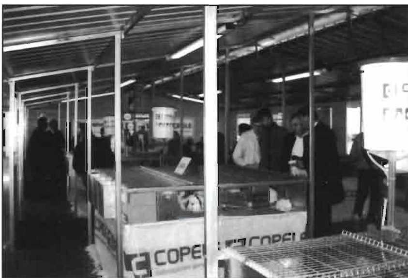
La instalación de la exposición de conejos vivos fue incluida en un pavellón ferial dentro de un prototipo de CUNINAVE (Copele). La muestra recibió numerosos visitantes a lo largo de todos los días de exhibición.