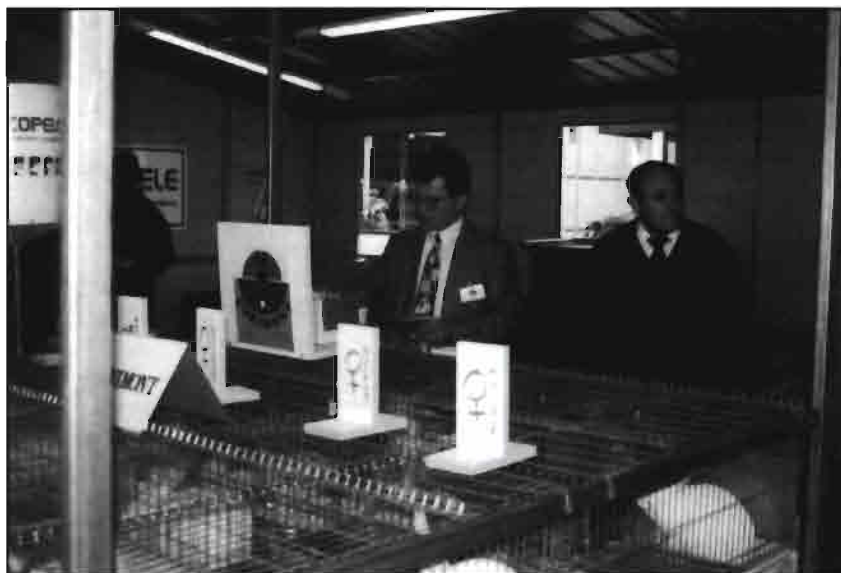
Detalle de la exposición de conejos vivos, con identificación de los animales.

granjas, junto al ganado vacuno, porcino, ovino, etc.