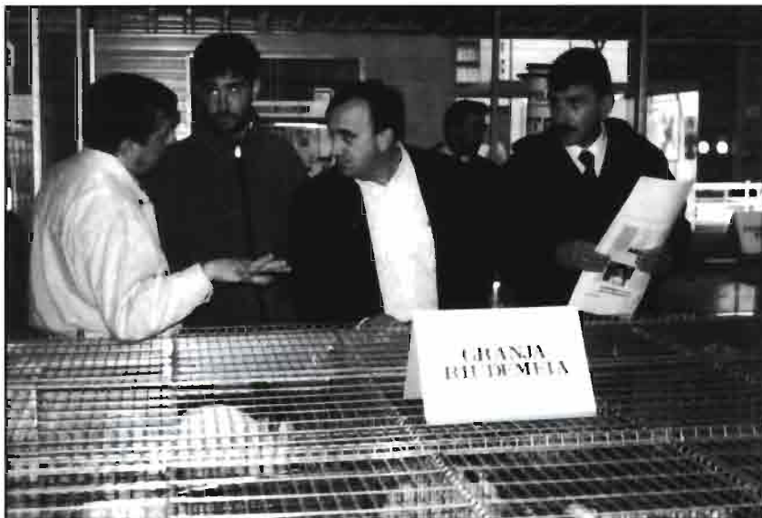
Cada una de las granjas participantes dispuso de un lote de animales y un pequeño stand.

Una de las numerosas maneras de salir a la luz, de dar a conocer un potencial y poder entrar en las estadísticas, censos, atenciones y ayudas es, sin ningún género de dudas, mostrar ejemplares de nuestras mejores