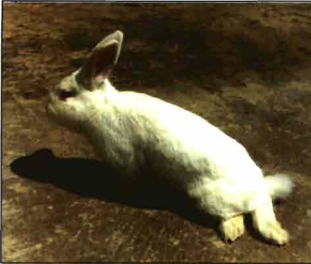
Parálisis muscular característica