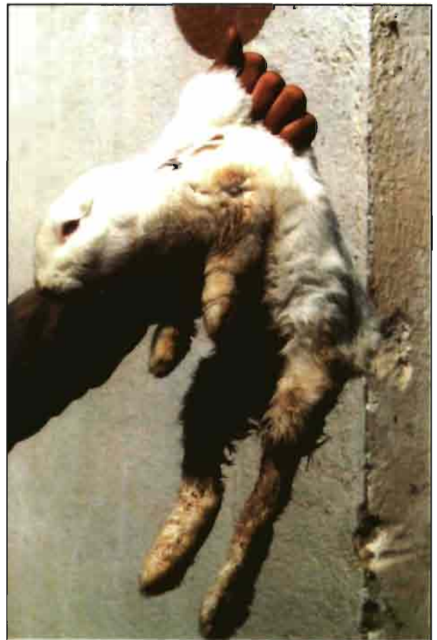
Fase terminal de la paraplegia, con caquexia y diarrea

Parálisis neurotóxica: determinadas enterotoxemias causan síntomas paralíticos en los animales afectados.