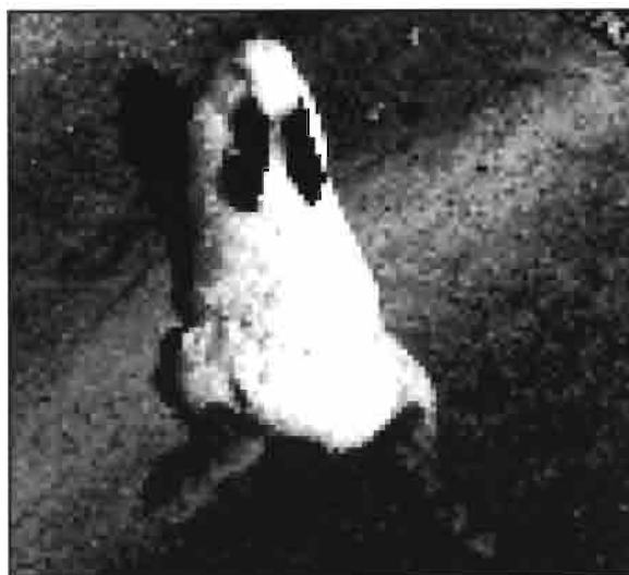
Actitud característica de foca

Por lo general esta alteración se presenta a nivel de las articulaciones de las vértebras toracolumbares o coxo-lumbares. En este tipo de accidentes se aprecia una paraplegia rígida o flácida, con o sin incontinencia fecal o urinaria.