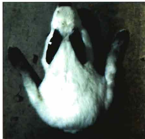
Actitud sentada, parálisis flácida.

En ocasiones las enterotoxemias producen neurotoxinas paralizantes.