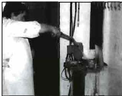
Cortadora de manos.

la longitud de las canales, pudiendo entrar colgados los conejos por las dos piernas o sólo con una.