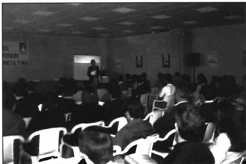
Aspecto de la sala del Symposium, al que asistió numeroso público.

usanza -cuando se servía sólo pulpo gallego y churrasco-, una megafonía siempre deficiente y con el punto de encanto de ser una feria de «pueblo».