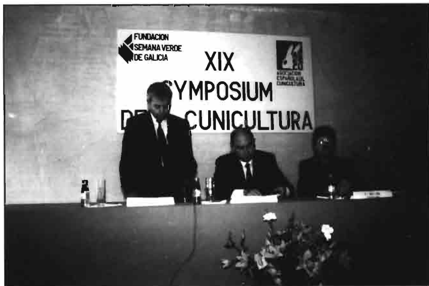
Presidencia del acto inaugural del Symposium.

La Semana Verde era la feria-fiesta popular por antonomasia, abigarrada y multicolor como pocas, semi campes- tre, rural y un tanto improvisada, a base de pabellones pre-fabricados, tendere- tes, empinados senderos y avenidas, con tiendas de restauración a la vieja