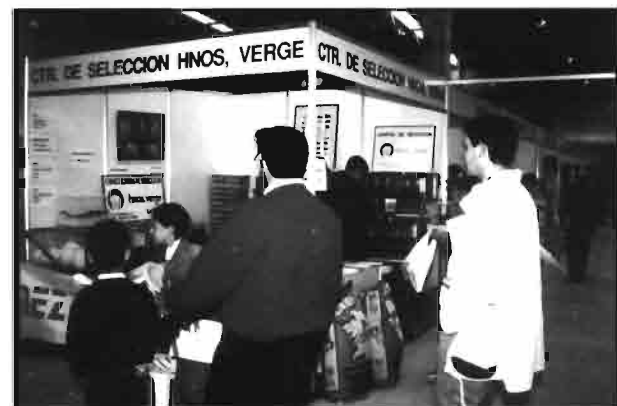
Algunas imágenes de la feria sobre cunicultura en el pabellón de ganadería de la Semana Verde.