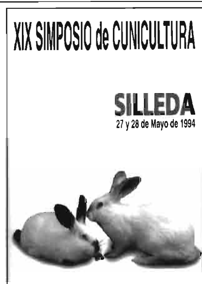
Memoria del XIX Symposium Cunicultura. Silleda. Ed. 1994. 2.500 Pts.

* Envío gratuito a los asociados previo envío de: 1 volumen 250 Pts. 2 volumen 350 Pts. 3 volumen 500 Pts.