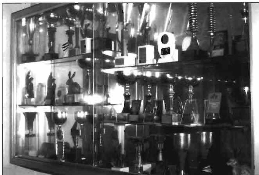
Después de años de dedicación y selección, la granja Riudemeia posee numerosos premios y distinciones procedentes de concursos en los que ha participado.