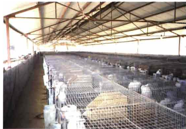
En Cerroblanco de Mancera (Gu), una estructura metálica cobija 430 hembras y 60 machos.

En todos los pueblos por los que circulamos observamos tiendas de distribución de alimento y material ganadero. Es manifiesto que la evolución esta en marcha.