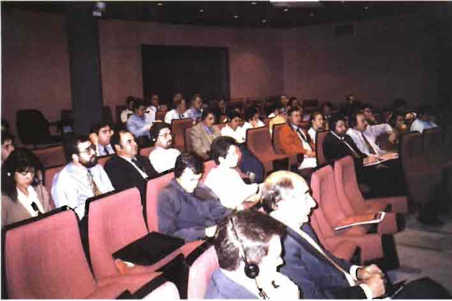
Asistieron a la reunión numerosos técnicos del sector, especialmente del campo de la nutrición animal.

ni de otros órganos (hígado, riñón, bazo...). A lo sumo, el intestino afectado presenta una ligera depresión (aplanamiento) de las placas de Peyer.