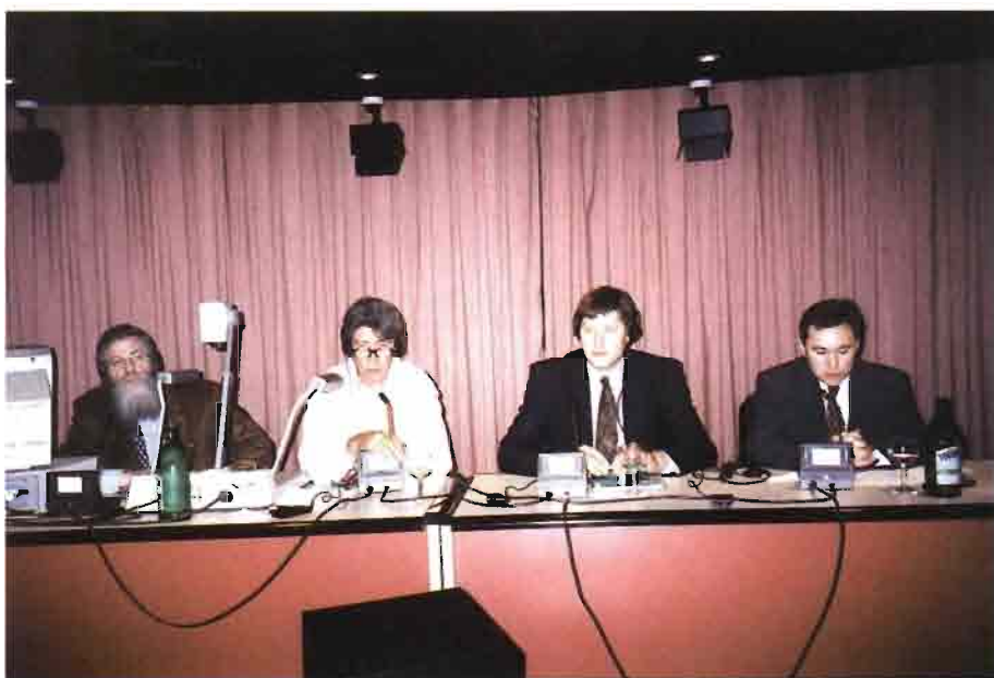
Presentación de los ponentes de la Jornada sobre Enteropatías del Conejo organizada por Roche, celebrada el pasado 19 de mayo en la sala de Actos del Parque Empresarial San Fernando (Madrid).

El aspecto novedoso de esta enfermedad se sospechó en el año 1997, entre los meses de marzo y abril, en que comenzó a afectar seriamente al País del Loire, con granjas en las que el nivel de afectación alcanzó el 60 % e incluso el 80 %; la antibioterapia fue ineficaz y se constató la existencia en otras partes de Europa.