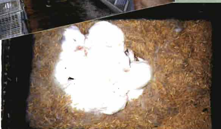
Nidal cuya cama está compuesta de cascarilla de arroz.