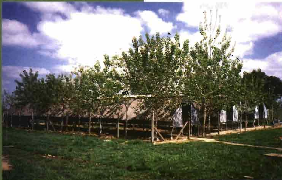
Vista general de las naves "Open air" en la granja.

Cabe significar la necesidad de mejora zootécnica entre los reproductores puesto que, aún manteniendo una notable presencia en su fenotipo (originarios de los Estados Unidos), su potencial está lejos del potencial de sus razas: California y Neozelandés Blanco. Así pues los partos no exceden de promedio de los 7,1 gazapos nacidos vivos y, con una mortalidad del 14 % del nacimiento al destete, sólo destetan 6,1 gazapos por parto a los 35 días de vida, con pesos de 700-750 gramos. Destacamos la presencia de cascarilla de arroz como cama en los nidales, lo que no ofrece un