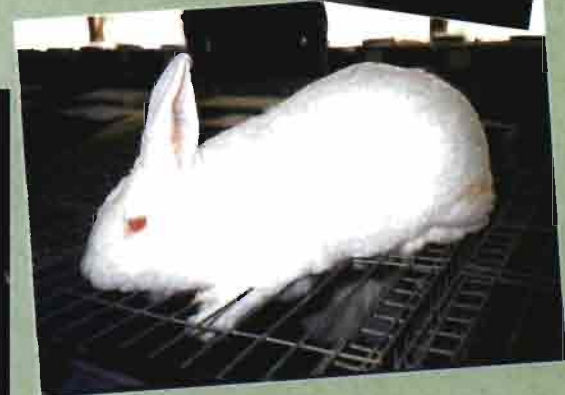
Neozelandés blanco dispuesto para la venta como reproductor.