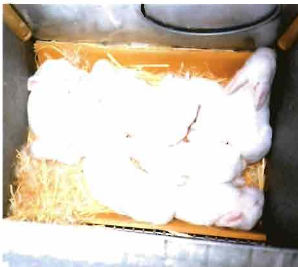
Evidencia de una camada sana y bien alimentada

FORUM INSEMINACION «semén propio o de un Centro especializado» envíe sus experiencias, opiniones, resultados, preferencias o dudas a: