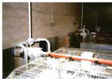
Vista general de la granja "nueva" Tarancón