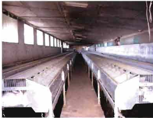
Vistas interiores de la nave en la Granja inicial con las últimas instalaciones

Todo el material es Extrona y está distribuido en 4 naves con: 520 jaulas, 376 jaulas, 220 jaulas y 130 jaulas = 1.246 jaulas totales, de las cuales 160 jaulas se destinan a reposición y gestación con 2 huecos cada una (capacidad para 320 hembras) y 60 jaulas para los machos reproductores usados para captar semen, una