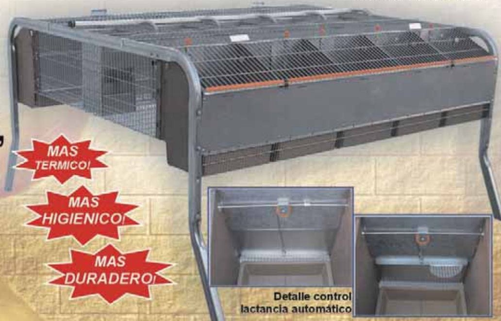
Detalle control lactancia automático