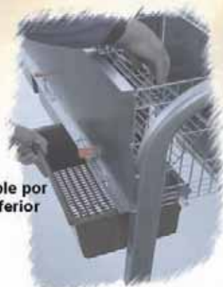
Nido extraíble por la parte inferior

Equipado con 2 puertas por jaulón, una con acceso a la parte trasera del hueco y la otra para el manejo del nidal, siendo esta última de gran utilidad como mesa de apoyo para efectuar los trabajos de palpación, inseminación, tratamientos, etc... y todo ello con el mínimo esfuerzo y máxima comodidad para el cunicultor.