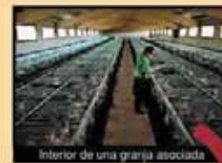
Interior de una granja asociada