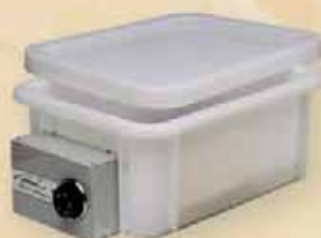
Baño María (Varios modelos y tamaños).