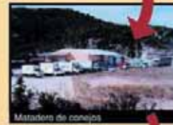
Matadero de conejos