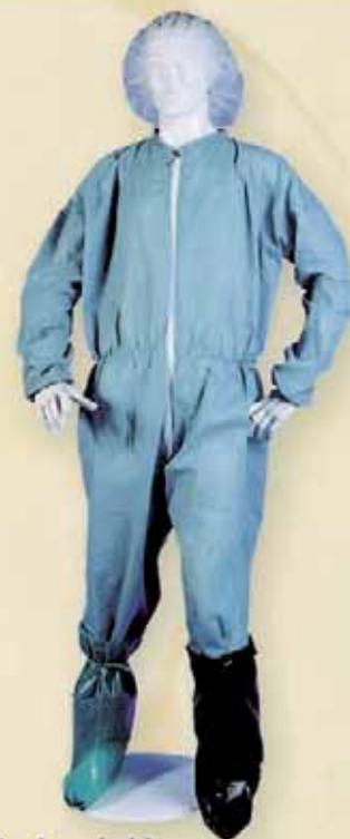
Vestuario desechable para entrada en granjas.