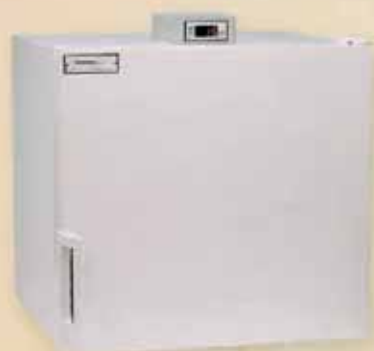
Neveras de conservación de semen de 70 litros.