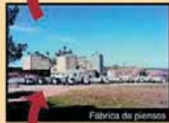
Fábrica de piensos