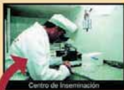
Centro de Inseminación