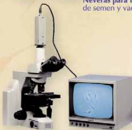
Microscopios (Varios modelos).