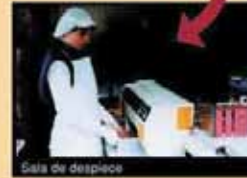
Sala de despiece