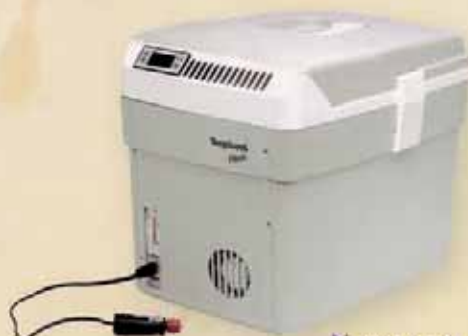
Neveras para transporte de semen y vacunas.