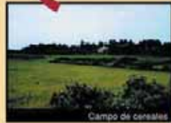
Campo de cereales