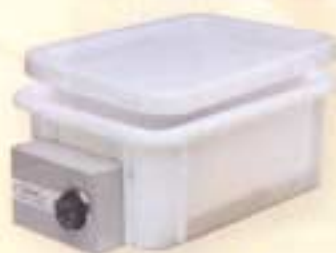
Baño María (Varios modelos y tamaños).