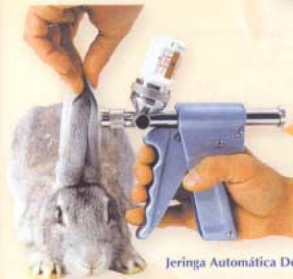
Jeringa Automática Dermojet.

REPARACIÓN DE JERINGAS DERMOJET, CON RECAMBIOS ORIGINALES.