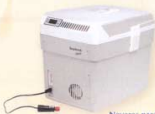
Neveras para transporte de semen y vacunas.