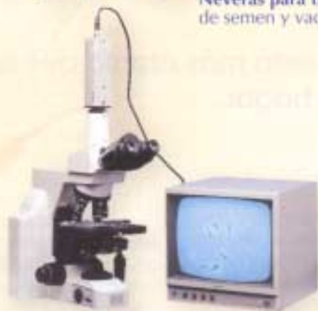
Microscopios (Varios modelos).