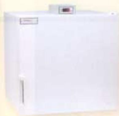
Neveras de conservación de semen de 70 litros.