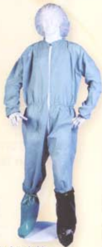
Vestuario desechable para entrada en granjas.