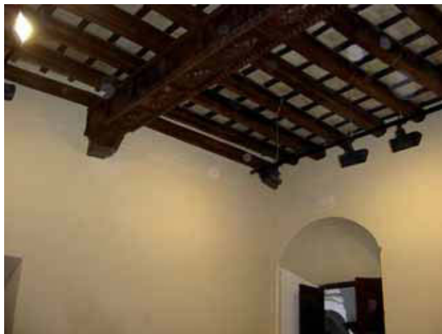
SALA Nº 3 TOTALMENTE TERMINADA

A día de hoy la planta alta se encuentra con la solería totalmente colocada a falta de abrillantar; en algunas zonas se tendrán que colocar falsos techos de escayola, quedando el resto con la madera y el ladrillo visto. Toda la madera de los techos se ha restaurado y el ladrillo se ha limpiado; se ha completado la instalación de aire acondicionado (tan importante en este tipo de edificios) y la de protección contra incendios y se han colocado todos los circuitos de la instalación eléctrica e iluminación. Por lo tanto, a falta de carpinterías, pintura y luminarias se encuentra casi terminada.