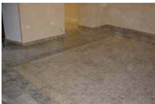
SOLERÍA DE SALA Nº 3 TOTALMENTE TERMINADA

Actualmente podemos afirmar que en breve se podrá visitar parte de la zona noble totalmente terminada, aunque el resto, como veremos más adelante se encuentra en un estado muy avanzado.