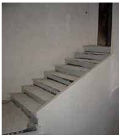
NUEVO TRAMO DE ESCALERA PRINCIPAL

Es lógico que estas modificaciones en la ejecución de los trabajos produzcan ciertas variaciones en los presupuestos, no sólo a la hora de hacer frente a las diferentes partidas no incluidas en proyecto que han aparecido durante el desarrollo de las obras, sino también a la hora de repartir el total del presupuesto en función del orden de ejecución de las mismas. Por lo tanto otra de las dificultades ha sido llegar a un cierto equilibrio entre el orden de los trabajos ejecutados "encajándolos" en el presupuesto original ya faseado. Así, ha sido necesario llevar a cabo partidas en una fase previa a la que le correspondía. De esta forma se ha conseguido desarrollar más del 90% del proyecto original, estando terminadas al 100% algunas salas de exposición.