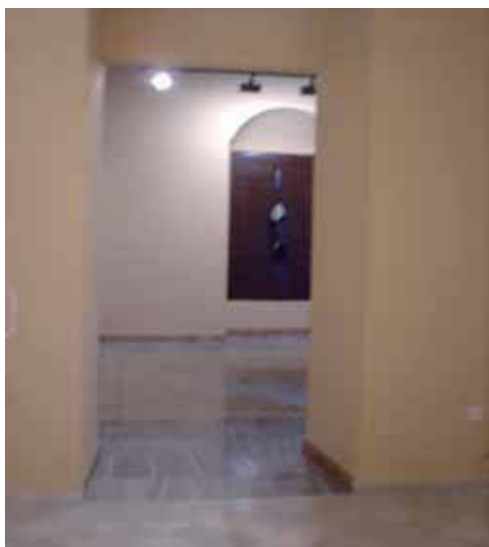
SALA Nº 3 TOTALMENTE TERMINADA

La sala nº 4 se ha terminado igualmente, incluyendo techos de yeso y escayola, instalaciones, pinturas e iluminación. Se ha colocado la carpintería original, restaurada por la Escuela Taller creada para tal fin, aunque en la actualidad se ha colocado un panel rehundido cegándolas para salvaguardarlas mientras se termina el resto de trabajos, posibilitando de esta forma el uso de la sala a día de hoy.