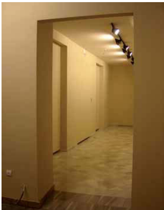
SALA Nº 4 TOTALMENTE TERMINADA

En la sala nº 3, en fachada, se ha recuperado el techo completamente, repasando toda la madera y el ladrillo, incluso reconstruyendo la falsa viga central.