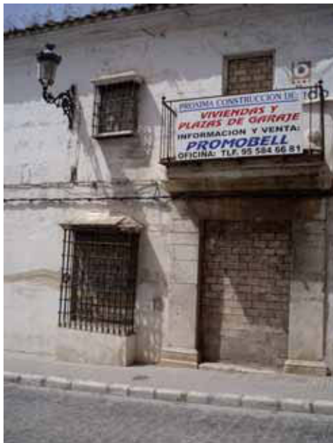
FIG. 10. UNA CASA EN RUINA

He disfrutado de la enorme fortuna cultural que atesoran los osunaenses. Me ha preocupado la considerable cantidad de casas abandonadas y casonas en ruinas (Fig.10). Es un anticuado tópico pensar en que todas se conviertan en museos, centros culturales, de ocio y hostelería. Es indispensable reemplazar la antigua forma de analizar los problemas a partir de la unidireccional relación entre causa y efecto, por una actual manera de comprensión sistémica y de visión holística. El patrimonio no es un todo que resulta de la simple acumulación de partes o piezas (monumentos, zonas arqueológicas, sitios históricos, jardines, etc.). No. Es un sistema dinámico y abierto. Para garantizar su funcionamiento es necesario tomar en cuenta el todo y el entorno; el todo y la inter-relación entre las partes que lo constituyen. No es fácil conseguirlo; sin embargo cuanto antes se comience, mejor. La Sociedad de Amigos de los Museos, ya lo ha hecho. No solamente está interesada en los de Osuna y Andalucía. Participa en una red europea. La red es la infraestructura del sistema.