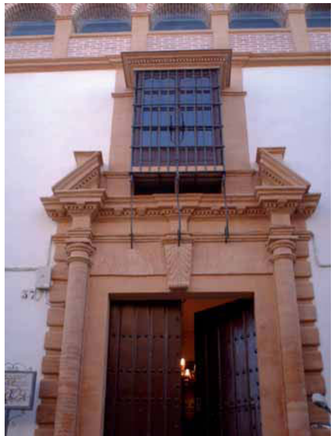
CUERPO CENTRAL DE LA FACHADA PRINCIPAL

En primer lugar quisiera explicaros en pocas palabras lo complicado de este tipo de obras, a saber: obras subvencionadas con un presupuesto cerrado cuyo desarrollo se ve modificado día a día al tratarse de una rehabilitación.