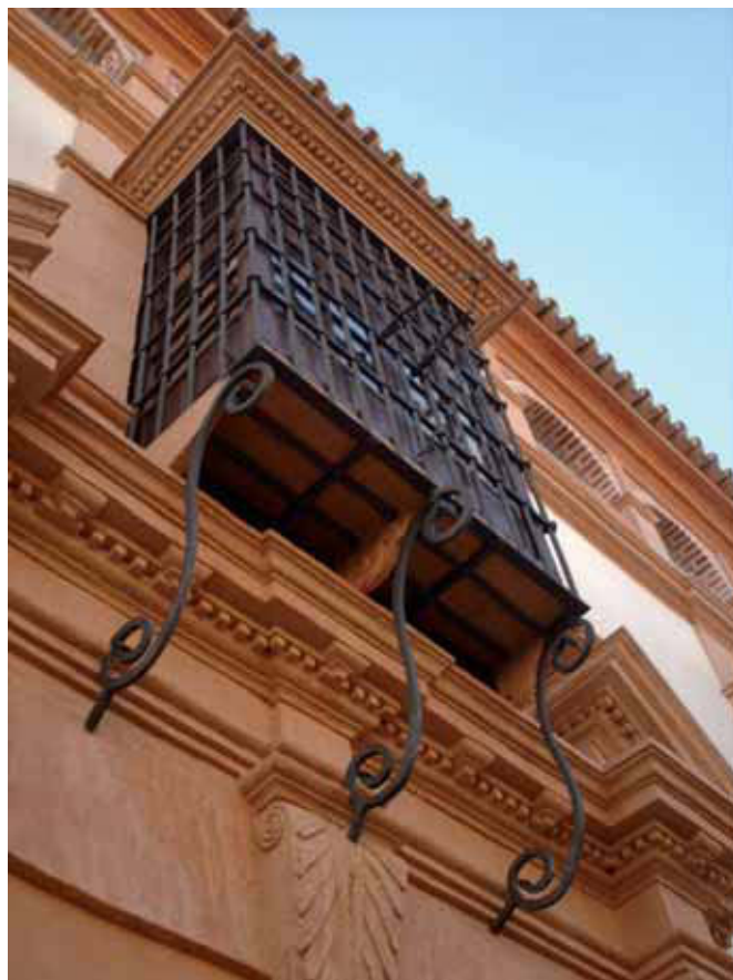
DETALLE DE CIERRO RESTAURADO EN FACHADA PRINCIPAL

Por último se ha colocado toda la carpintería de la fachada principal, los nuevos balcones, habiendo repasado y pintado los cierros originales. Como habréis visto, en la zona del soberao se han colocado cristales “a hueso” a modo de barandilla o antepecho, separados del cierre del medio punto dejando un espacio intermedio, asegurando de este modo la ventilación necesaria y original en este espacio.