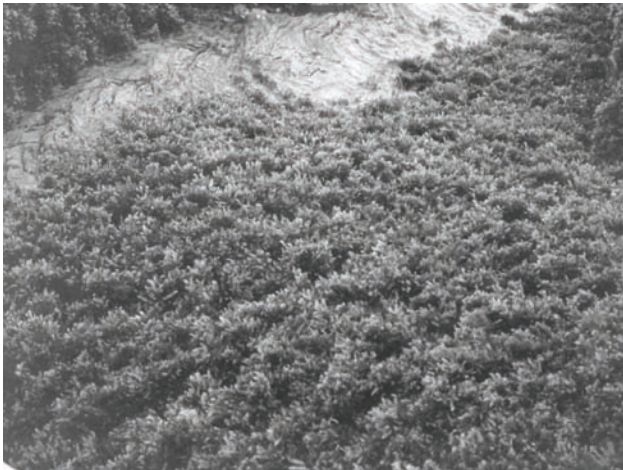
Figura 1. Banco de Sargassum no litoral do estado do Rio de Janeiro, durante maré baixa de sizígia.

locais para fixação de invertebrados, como descrevem Ostini et al. (1992), para o mexilhão Perna perna (Linnaeus, 1758). Kirkman & Kendrick (1997), revisando a importância ecológica de macroalgas arribadas na Austrália, ilustram a alimentação de aves marinhas a base de peixes associados a massas de Sargassum , flutuantes ou jogadas na areia das praias.