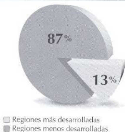
Gráfica 1. Proporción de la población mundial correspondiente a las regiones más desarrolladas y menos desarrolladas