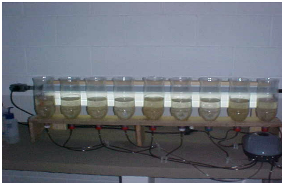
FIGURA 1 – Conjunto de nove garrafas para eclosão dos oocistos e duas lâmpadas fluorescentes em suporte de madeira. As mangueiras de silicone foram acopladas nas tampas das garrafas para aeração.

Cinqüenta e três horas depois que os oocistos foram colocados para eclodir, foi iniciada a contagem para avaliação do número de náuplios eclodidos em cada tratamento. O processo utilizado para contagem consistiu da pipetagem de um volume equivalente a um mililitro do conteúdo de cada frasco de incubação, e a posterior distribuição desse volume em pequenas gotas sobre placas de plástico translúcido, as quais foram colocadas sobre uma fonte de luz para melhor visualizar os náuplios que foram contados diretamente. Cada gota sobre o plástico continha de nenhum a cinco náuplios, portanto a contagem era facilitada. Para todas as repetições foram feitas três contagens.