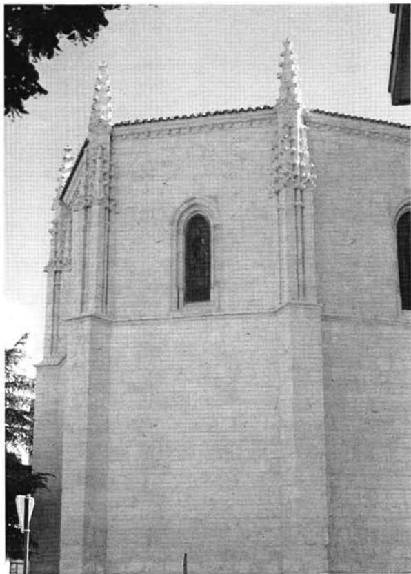
Imagen 3. Bartolomé de Solórzano y Gaspar de Solórzano. Detalle de la capilla mayor de San Lázaro de Palencia.