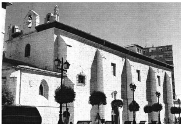
Imagen 1. Bartolomé de Solórzano. Santa Clara de Valladolid