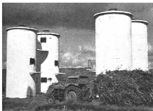
Figura 3. Vista de los silos construidos en la colonización y croquis del área colonizada de A Espiñeira (1966)

mutación del metabolismo social. Dicho cambio metabólico forzoso desestructuró el estilo de manejo de los recursos naturales de los agroecosistemas, las formas de sociabilidad y una buena parte de los elementos identitarios de la sociedad local. La transformación del metabolismo fue radical y bien visible: de un monte bajo, donde dominaban tojales y brezales (insustituible abono para las agras) y en el que éstas se completaban con las parcelas cultivadas de cereal (trigo sobre todo) en el monte mediante el sistema de rozas o estivadas, se pasó a una zona en la que praderas artificiales, acequias, silos cilíndricos, casas encaladas y los enormes campanarios de las iglesias de los pueblos de colonización dominan el espacio 16 . Se trata de la transformación de un paisaje cultural, el monte comunal y las agras, en un protopaisaje, un nuevo escenario totalmente ajeno a la realidad de la zona, sin aceptación social, nada connotado ni simbólico.