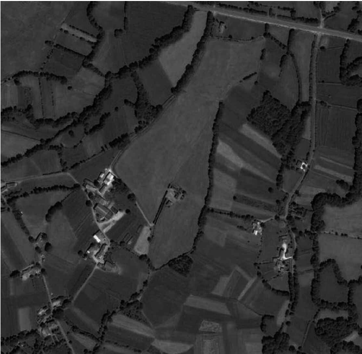
La supervivencia de su forma tradicional de uso (hasta finales de los noventa) y la conservación de la mayor parte de su morfología la convierten en uno de los últimos vestigios de lo que fue el "paisaje cultural" de la comarca.