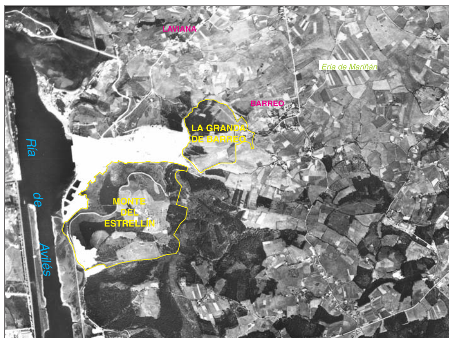
FIG. 3. Montes de «El Estrellín» y «La Granda». Estos montes, ubicados en la margen derecha de la ría de Avilés, fueron rematados en 1871 por miembros de la burguesía avilesina, acondicionándolos para el cultivo y estableciendo en ellos sus villas de recreo. El desarrollo industrial de Avilés en los años cincuenta provocó notables transformaciones en el paisaje y en los usos del suelo a causa de la situación estratégica de ambos predios. Escala aproximada del original 1:30.000.