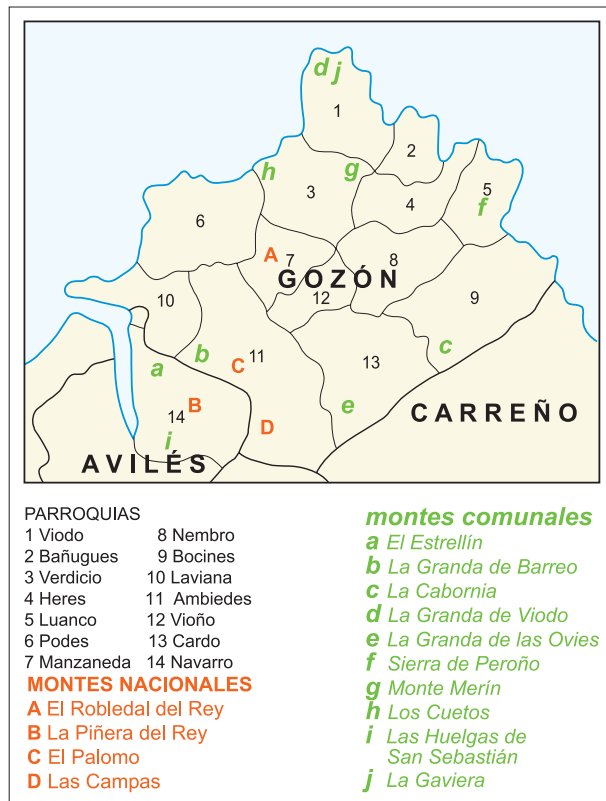
FIG. 1. Localización de los montes comunales y nacionales en el área de estudio.

En realidad, este contraste venía acentuado por la naturaleza de las rocas, ocupando los montes los suelos paleozoicos, constituidos por la cuarcita formación Barrios en la rasa del Cabo Peñas y por las areniscas ferruginosas formación Furada, Naranco y Candás en las lomas o zonas elevadas situadas más hacia el E, mientras que las erías y demás tierras de cultivo se extendían sobre la covertera mesozoica, formada por arcillas, yesos y margas, que tamizan las áreas más deprimidas de la rasa y de los