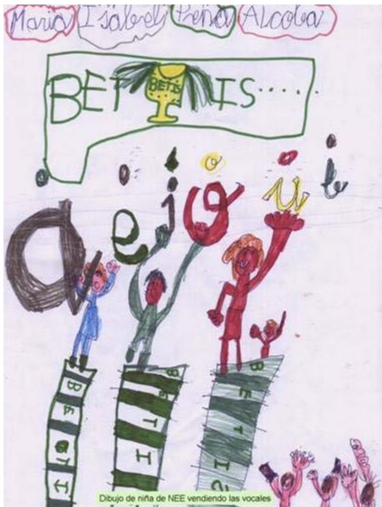
Dibujo de niña de NEE vendiendo las vocales