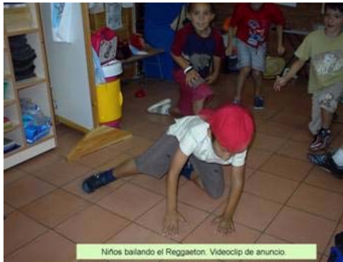
Niños bailando el Reggaeton. Videoclip de anuncio.