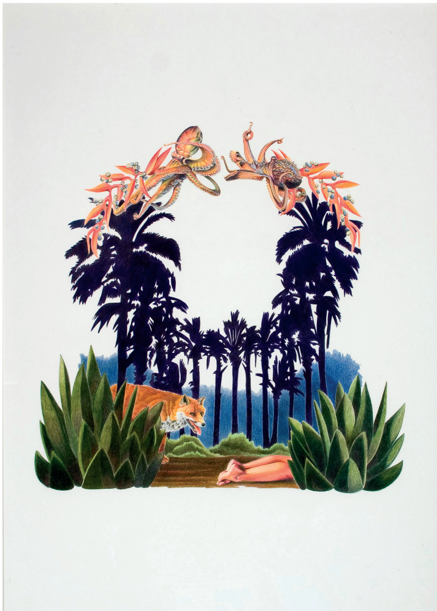
El beso del pulpo Lápiz de color sobre papel 50 x 70 cm. 2007