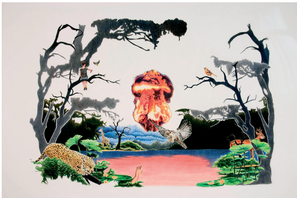
La jungla cubrirá todo Lápiz de color sobre papel 100 x 70 cm. 2007